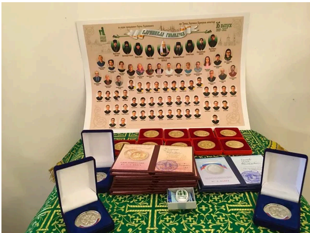
Аттестаты и медали 2021 года.

В 2021 году ученики гимназии продолжают занимать призовые места в различных олимпиадах.