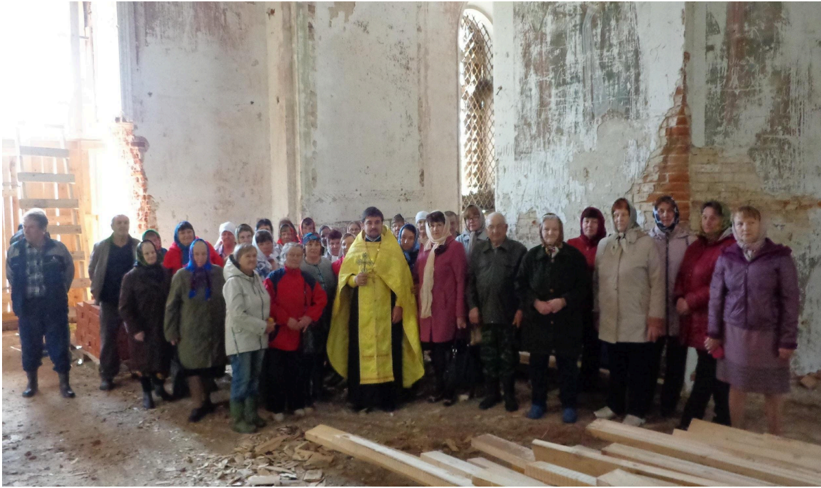
Молебен в Покровской церкви села Ухтым. Фото 2 июня, 2018 г.