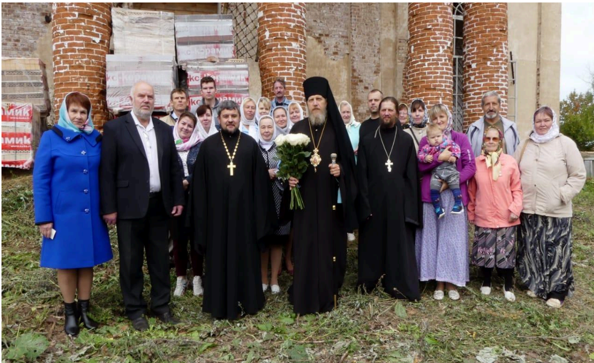
Литургия в Покровской церкви села Ухтым. Фото 8 сентября 2020 г.

В праздник Сретение Владимирской иконы Пресвятой Богородицы, в Покровской церкви села Ухтым (впервые за 90 лет) состоялась божественная Литургия, которую возглавил епископ Уржумский и Омутнинский Иоанн.