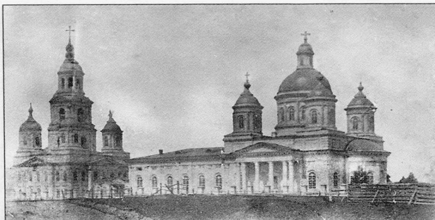
Илл. 125. Церковь Покрова. Южный фасад. Фот. нач. XX в.

Церковь Покрова села Ухтым. Южный фасад. Фото начала 20 века