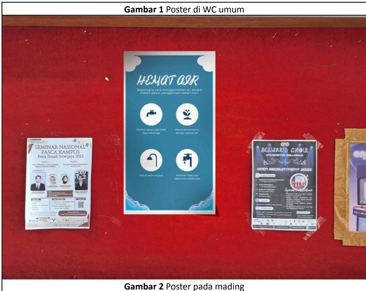
Gambar 2 Poster pada mading