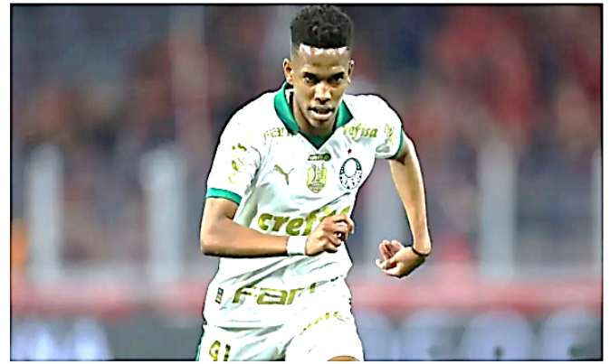
Estêvão em jogo do Palmeiras.

Um dos principais jogadores do Palmeiras na temporada, Estêvão , de 17 anos, ganhou a oportunidade de vestir a camisa da Seleção Brasileira .