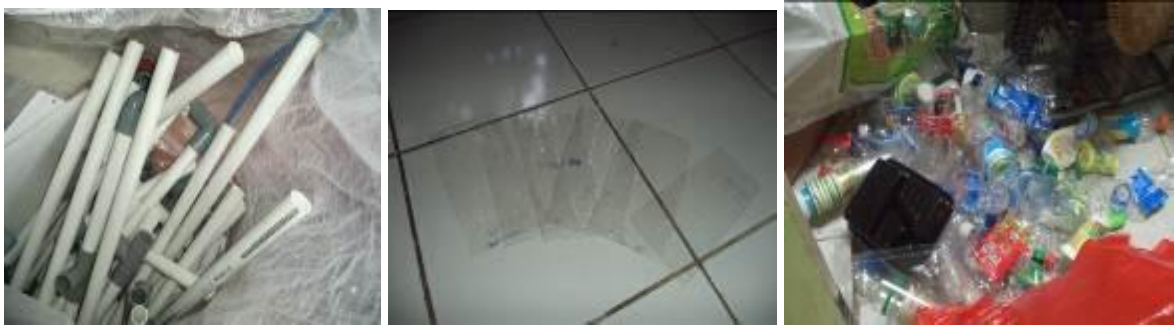
Gambar 3. Aktifitas persiapan objek

Proses yang dilakukan pada saat pemilihan dan pembersihan kotoran pada material yang akan digunakan, dimaksudkan agar peserta dapat mengetahui syarat dan kriteria dari bahan plastik yang akan digunakan. Karena secara tidak langsung akan berpengaruh terhadap kualitas hasil jadi dari produk hiasan. Gambar 3 menyajikan aktivitas persiapan obyek yang digunakan dalam kegiatan pelatihan.