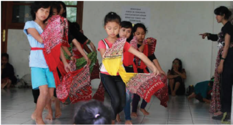
Gambar 3.7 Beberapa anak belajar tarian tradisional