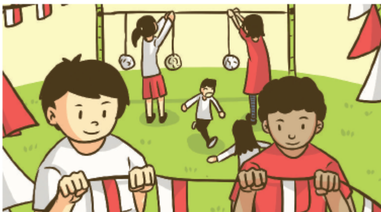
Gambar 3.5 masyarakat melakukan kerja bakti dalam menyambut agustusan.

Perhatikan gambar berikut ini. Kemudian, ceritakan kaitannya dengan kegiatan pembelajaran saat ini di depan kelas.