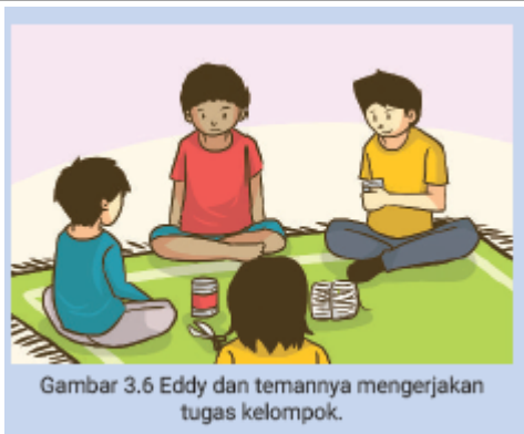
Gambar 3.6 Eddy dan temannya mengerjakan tugas kelompok.

Ketika mulai pelaksanaan kegiatan, terdengar lantunan suara adzan dari kejauhan. Kemudian, Suci dan Ujang meminta izin kepada yang lain untuk terlebih dahulu menunaikan ibadah shalat. Teman-temannya memaklumi dan mengizinkan mereka untuk melakukan ibadah. Eddy mempersilakan Suci dan Ujang shalat secara bergantian di dalam kamarnya. Eddy memang beragama Katolik, tetapi ia tidak merasa keberatan kamar di rumahnya dipakai untuk shalat. Sementara itu, teman-temannya yang juga beragama lain; Boni, Dayu, dan Lani tetap menunggu dengan sabar temannya yang sedang beribadah. Keenam anak yang bersahabat ini menghargai satu sama lain.