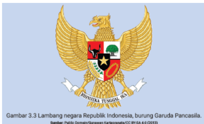
Gambar 3.3 Lambang negara Republik Indonesia, burung Garuda Pancasila.

”Bagus. memang benar tulisan semboyan Bhinneka tunggal ika sering kita temukan pada lambang negara. Nah setelah kalian memperhatikan gambar lambang negara kita, diantara kalian ada yang tahu arti semboyan Bhinneka tunggal ika ?” Tanya Bu Indah.