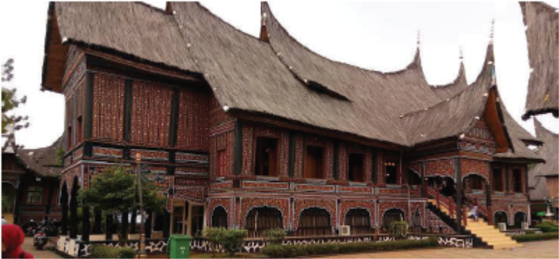
Gambar 3.2 Rumah dan pakaian adat pada suatu daerah di Indonesia

Perhatikanlah gambar berikut ini. Kemudian, ceritakan dan jelaskan yang kamu ketahui di depan kelas.