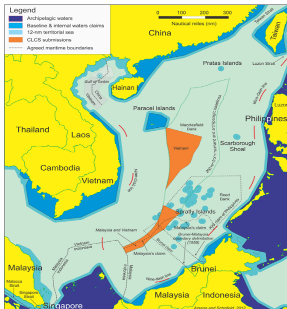
Figure 1. The South China Sea Power Struggle