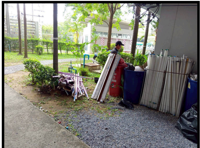
Example of Toxic Waste Treatment