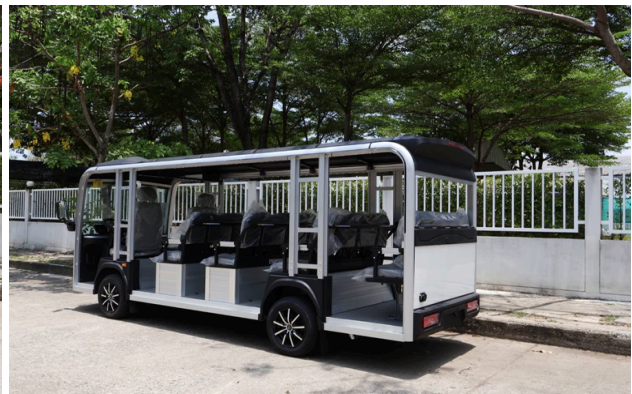
Zero-emission campus shuttles are scheduled to launch in the third quarter of 2026