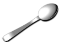
der Löffel, --