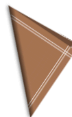
die Serviette, -n