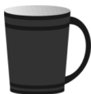
die Tasse, -n