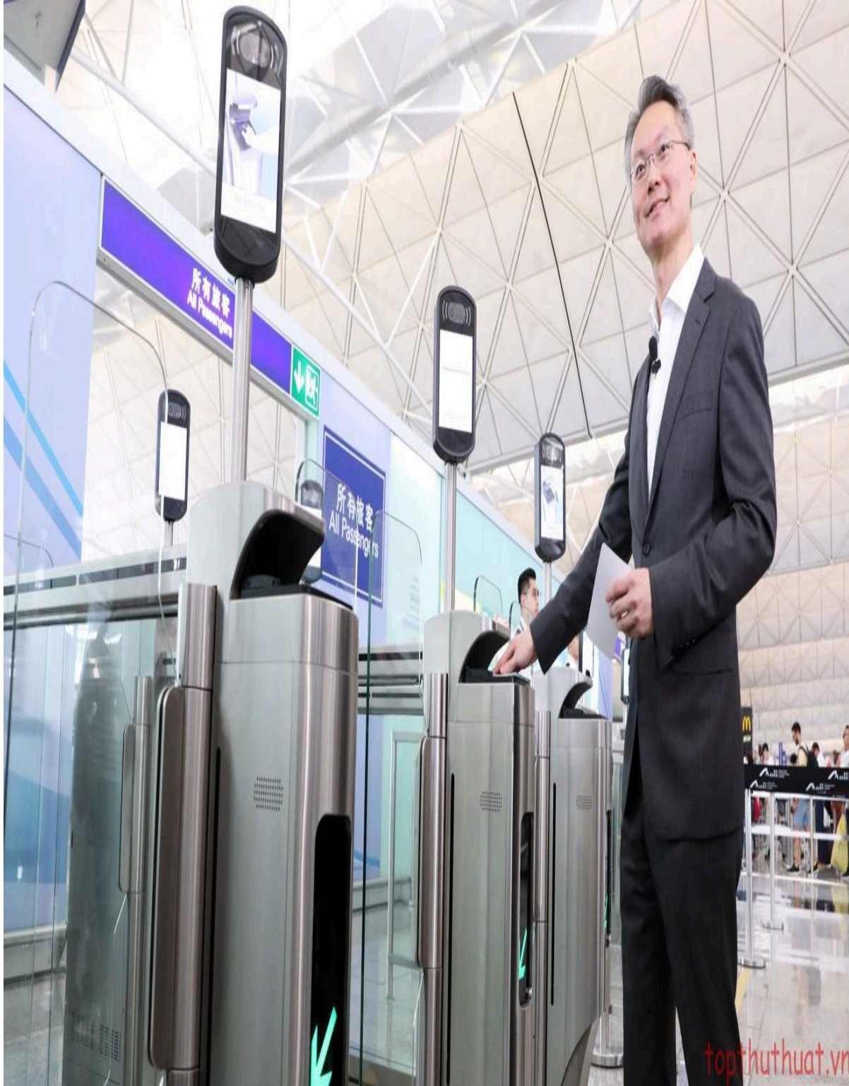
Hệ thống chấm công bằng khuôn mặt