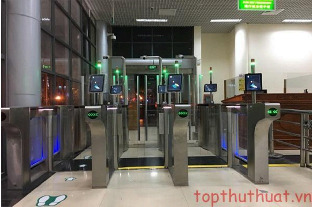
Hệ thống chấm công bằng khuôn mặt