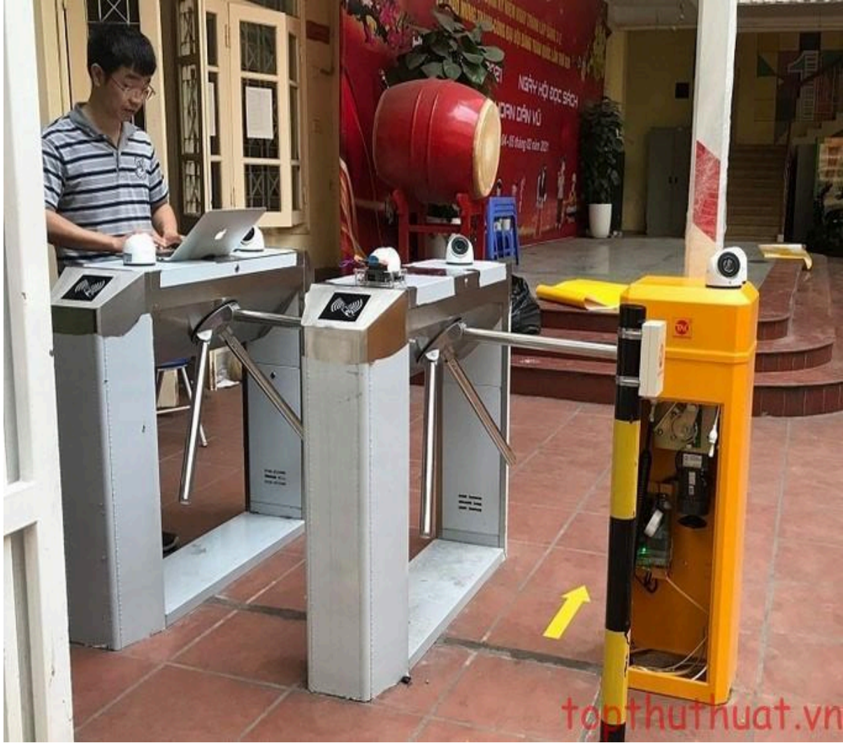
Kiểm soát ra vào nhận diện khuôn mặt