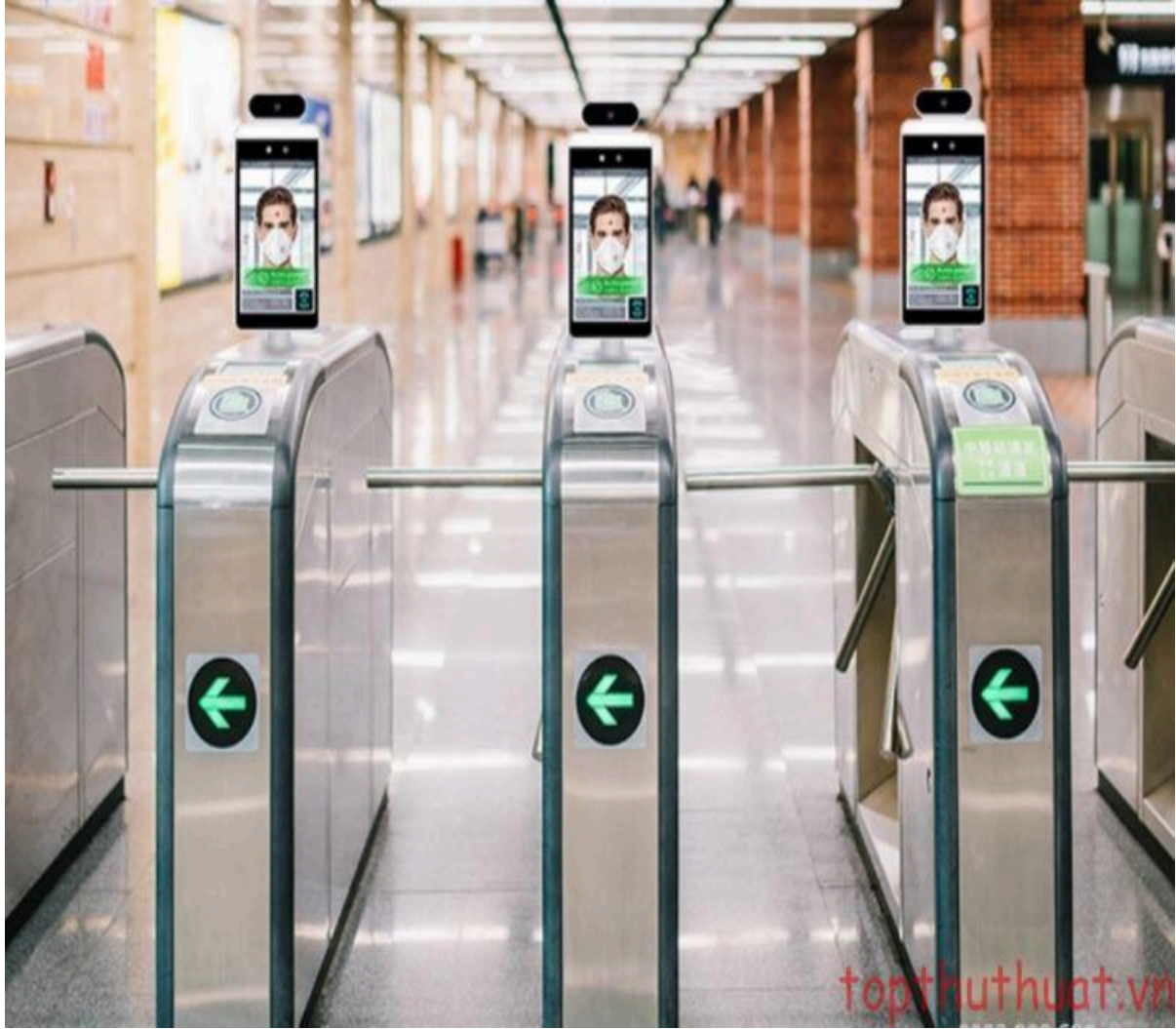
Hệ thống chấm công bằng khuôn mặt