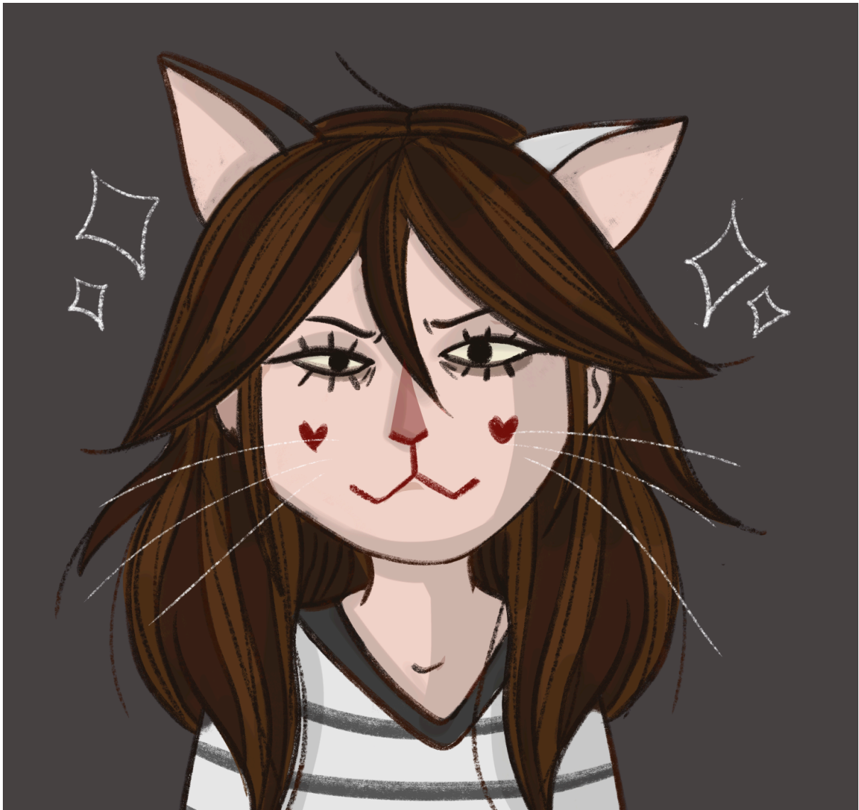
Na obrazku powyżej: ja, idiota bez okularów 2023 koloryzowane