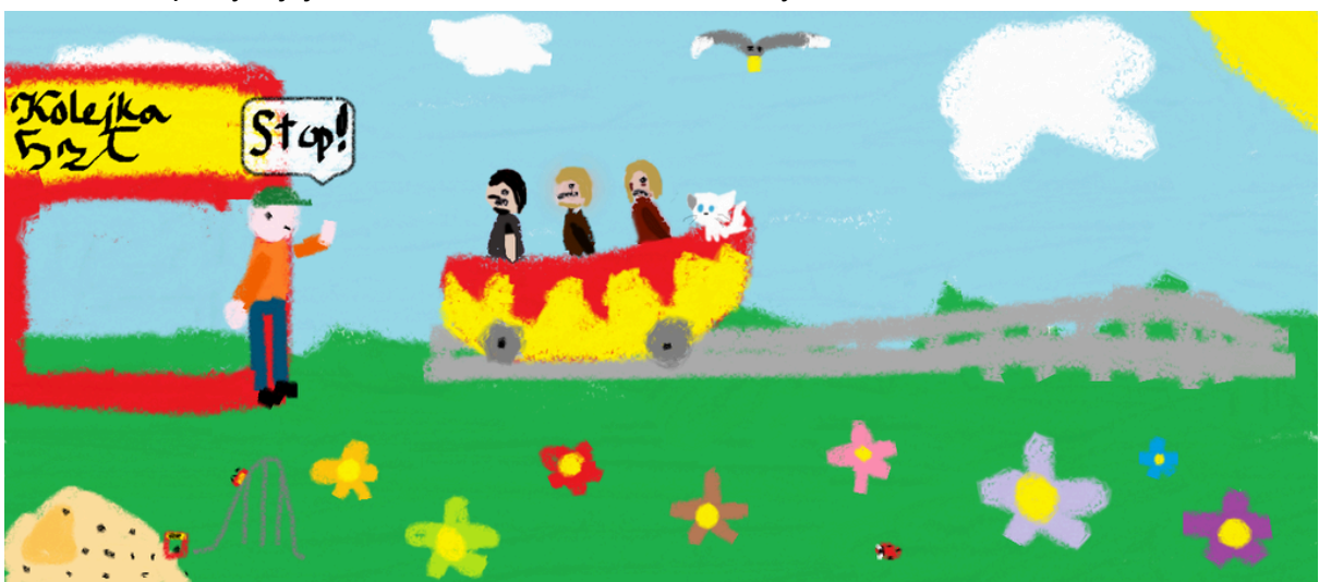
Wciąż bawi, jak wtedy xD