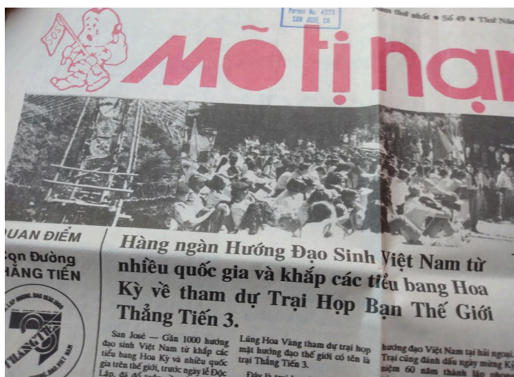
Một công tác điển hình của Hướng Đạo Việt Nam ở hải ngoại ,