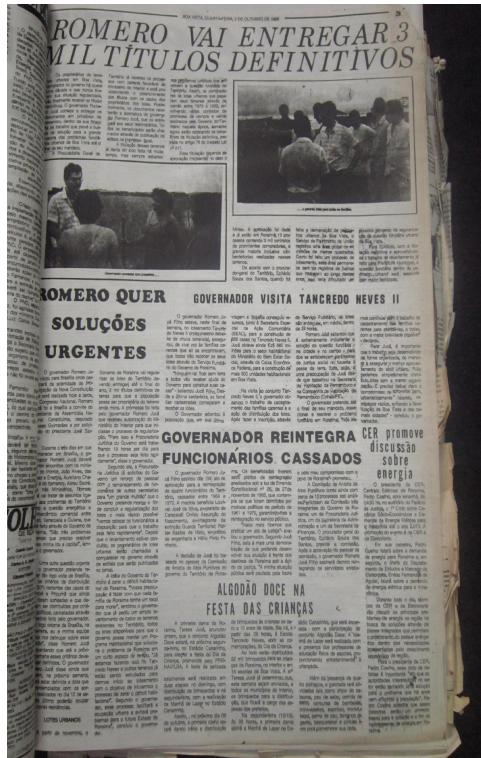
Folha de Boa Vista 16 de outubro de 1988