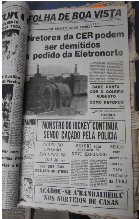
Folha de Boa Vista, 23 de outubro de 1988