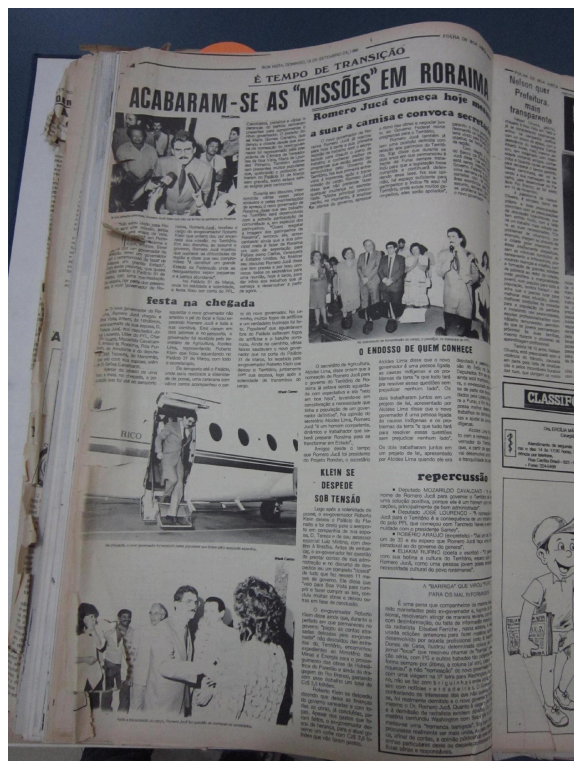
Folha de Boa Vista de 28 de setembro de 1988