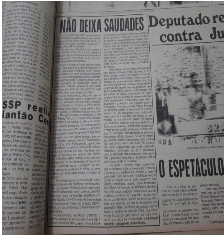
Festa na chegada do governador