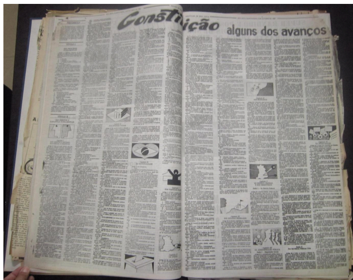
Figura 3 – Ilustração da Constituição de 1988

Para deixar a população a par da lei, a Folha de Boa Vista utilizou as páginas 4 e 5 (n. 478) para publicação do texto referente à Constituição Federal. O texto está disposto em colunas e acompanhado de figuras ilustrativas, como se percebe logo abaixo: