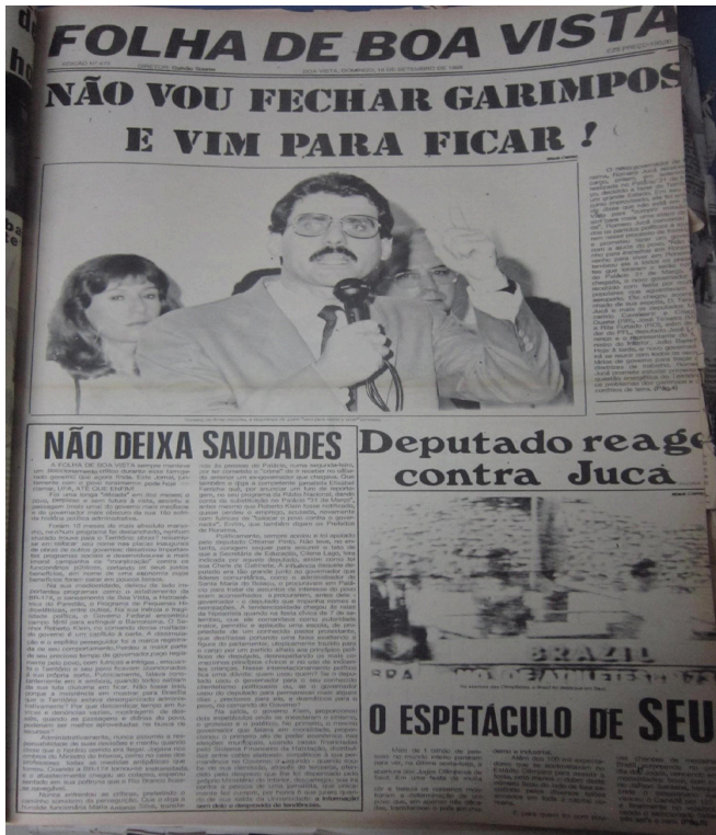
Capa do jornal Folha de Boa Vista – 18 de setembro de 1988

Nota estampada na capa do dia 18 de setembro