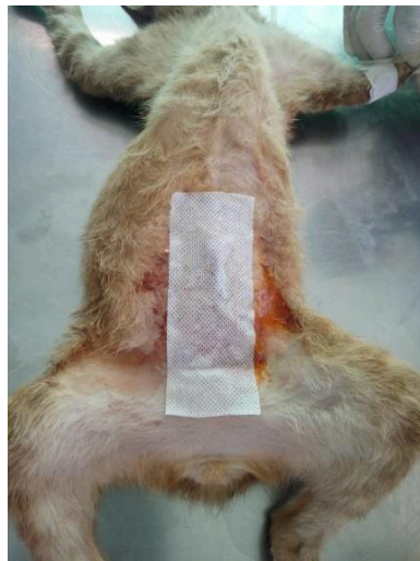
Gambar 2. Luka sayatan dibalut dengan plester