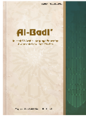
Gambar 1. Judul Gambar

Pastikan tabel tidak terpotong dan sederhana. Tabel hanya menyajikan data yang dibutuhkan.