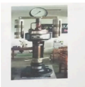
Gambar 2. Contoh gambar dengan resolusi kurang

Gambar 2 menunjukkan contoh sebuah gambar dengan resolusi rendah yang kurang sesuai ketentuan, sedangkan Gambar 3 menunjukkan contoh dari sebuah gambar dengan resolusi yang memadai. Periksa bahwa resolusi gambar cukup untuk mengungkapkan rincian penting pada gambar. Harap periksa semua gambar dalam makalah Anda, baik di layar, maupun hasil versi cetak. Ketika memeriksa gambar versi cetak, pastikan bahwa warna mempunyai kontras yang cukup, gambar cukup jelas, dan semua label pada gambar dapat dibaca.