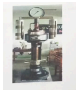
Gambar 3. Contoh gambar dengan resolusi baik

Gambar diberi nomor dengan menggunakan angka. Keterangan gambar ditulis dalam font ukuran 10 pt. Keterangan gambar harus diletakkan di bawah gambar dan rata tengah ( centered ). Tabel diberi nomor menggunakan angka. Keterangan tabel berada di atas tabel, rata tengah ( centered ), dan dalam font berukuran 10 pt. Setiap awal kata dalam keterangan tabel menggunakan huruf kapital. Keterangan angka tabel ditempatkan sebelum tabel terkait, seperti yang ditunjukkan pada Tabel 1.