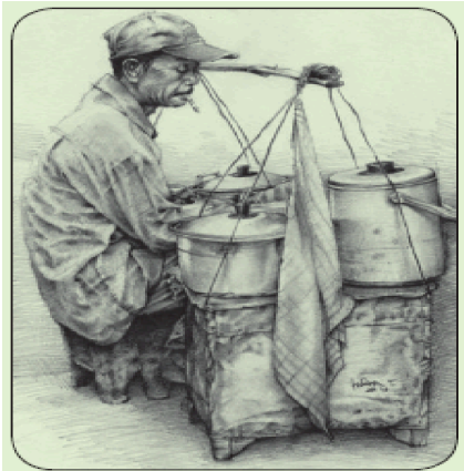
Teknik arsir Karya Indra (Menanti Pembeli)

Pada gambar dengan menggunakan media kering, biasanya digunakan teknik arsir. Teknik arsir dibuat dengan menorehkan pensil, spidol, atau alat lain berupa garisberulang yang menimbulkan kesan gelap terang dan kesan adanya dimensi. Selain teknik arsir, ada juga teknik blok. Teknik blok adalah teknik menutup gambar dengan menggunakan satu warna sehingga menimbulkan kesan siluet atau blok. Sedangkan cara penggunaan media basah biasanya memerlukan kuas untuk mengaplikasikan cat baik cat air maupun cat poster. Teknik sapuan basah menggunakan sapuan bahan dengan campuran air dia atas kertas.