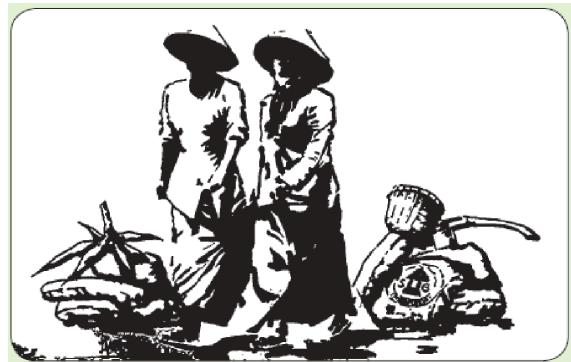
Teknik blok Karya @umar_farq (peperangan)