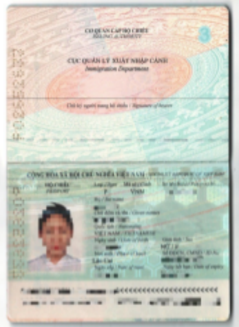
Mẫu thủ tục: Scan hoặc chụp ảnh hộ chiếu