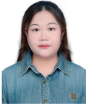
Mẫu thủ tục: Ảnh chân dung