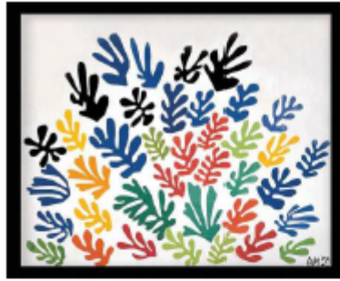
Gambar 5.7.2 Karya Henri Matisse berjudul La Gerbe (1953)