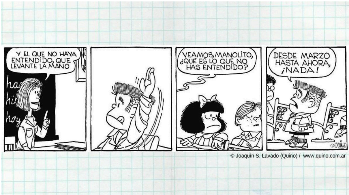
© Joaquín S. Lavado (Quino) / www.quino.com.ar

Realiza en doble hoja block un ejercicio de los orígenes de la gráfica latinoamericana contemporánea, orígenes del cómic .con las siguientes imágenes sugerida de artistas de este movimiento, te sugiero varios estilos , puedes cambiar sus colores