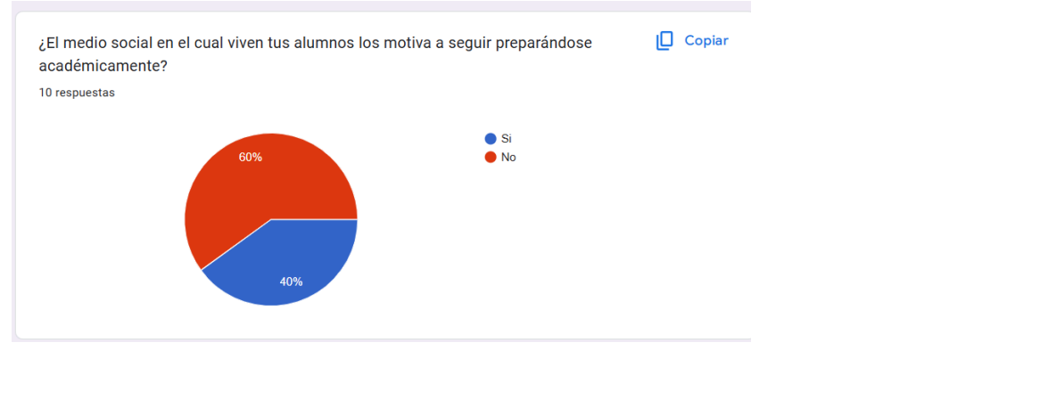
Gráfico 4 ¿El medio social en el cual viven tus alumnos los motiva a seguir preparándose académicamente?