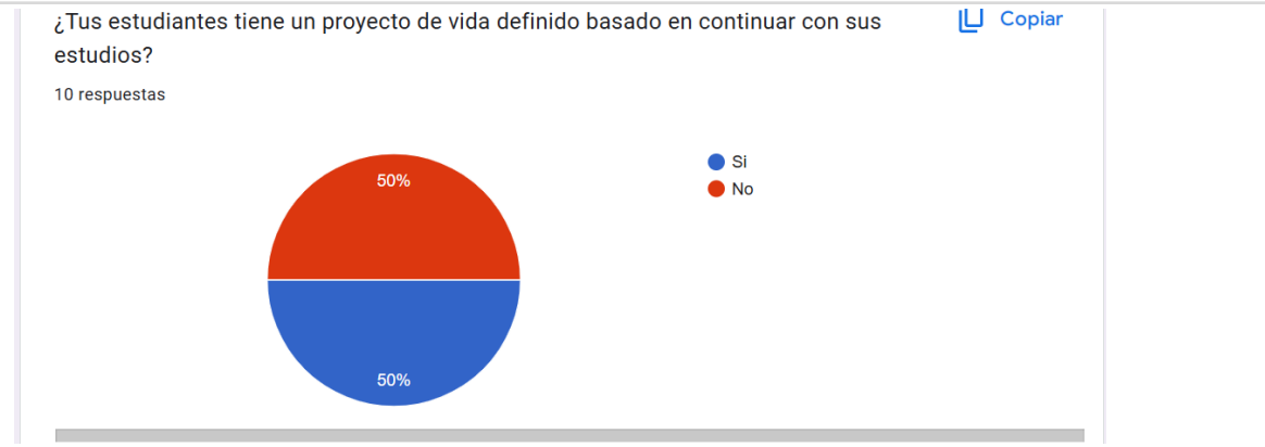
Gráfico 2. ¿Tus estudiantes tiene un proyecto de vida definido basado en continuar con sus estudios?

Un 20% nos indica que los estudiantes, sí usan las TIC para fines que mejoran su formación en actividades educativas.