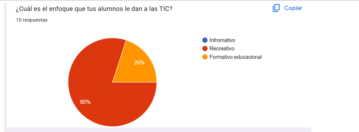
Gráfico 1. ¿Cuál es el enfoque que tus alumnos le dan a las TIC?