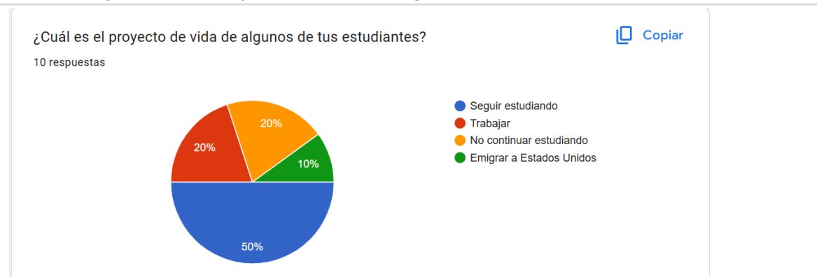
Gráfico 3. ¿Cuál es el proyecto de vida de algunos de tus estudiantes?

Desafortunadamente el otro 50%, carece de este proyecto de vida y no tiene bien definido lo que va a realizar una vez concluidos sus estudios de educación básica.