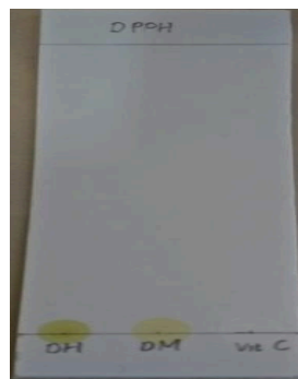
Gambar 1. Contoh gambar contoh gambar contoh gambar