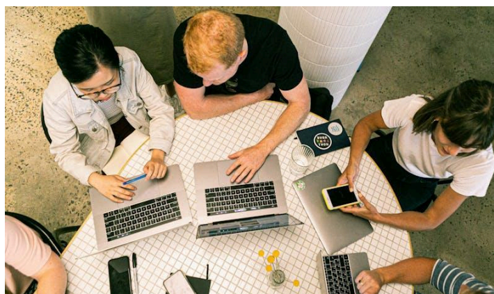
FOTO 1. KEGIATAN DISKUSI TENTANG PERENCANAAN BISNIS SEDERHANA

Jika diperlukan maka penulis dapat memasukkan foto dalam artikel. Kualitas foto harus tajam dan jelas jika diperkecil sampai dengan 50%. Tidak diizinkan memasukkan foto tanpa ada penjelasan narasi, dan letakkan dekat dengan narasi penjelasannya. Format pembuatannya sama dengan penulisan gambar (Foto 1). Judul foto diletakkan di bawah foto dan rata tengah dengan menggunakan huruf Titilium Web 10 Pt, kapital, spasi tunggal dan bold. Semua foto diberikan keterangan sumber dan ditulis di bawah judul foto (Titilium Web 9 Pt dan spasi Exacty 11 Pt). Penulis bertanggung jawab atas keaslian dan kebenaran penggunaan bahan yang dilindungi hak cipta, seperti ilustrasi, gambar, bagan, skema, dan lain-lain. Sebelum naskah diterbitkan pastikan bahan-bahan tersebut bebas dari tuntutan hak cipta atau kebenaran