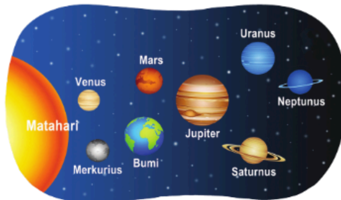
Gambar 2.5 Tata Surya

Pernahkah kalian memperhatikan hutan dan pegunungan yang indah?