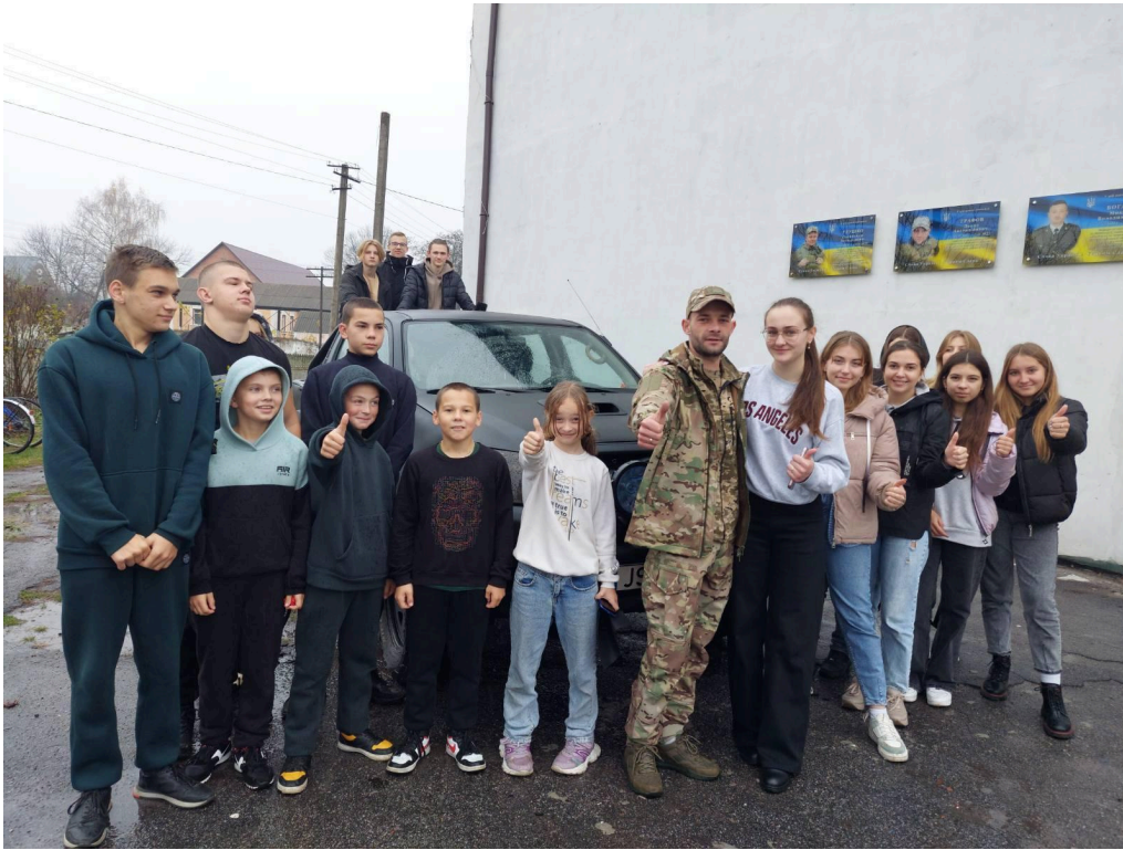
Акція «Допоможи ЗСУ»