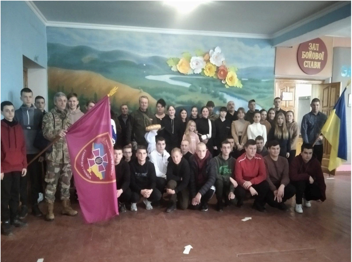
«Військово-патріотичний захід з бійцями полку «Бойове братство» Сувеніри для воїнів від дітей