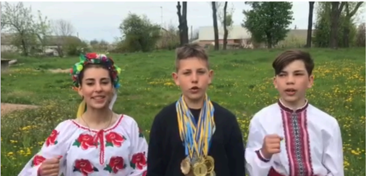
«Ми- такі !!!»