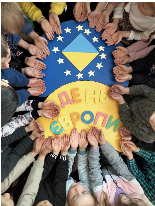
Конкурс на кращих знавців « Я і Європа »