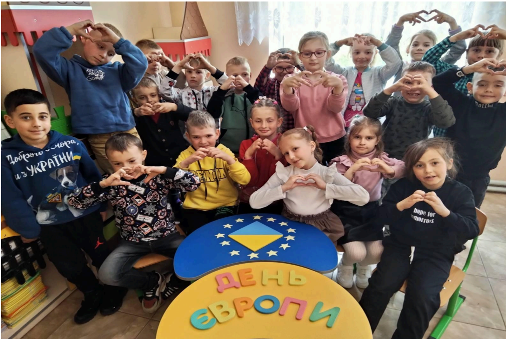
Взяли участь у національно-патріотичному конкурсі «Джура»