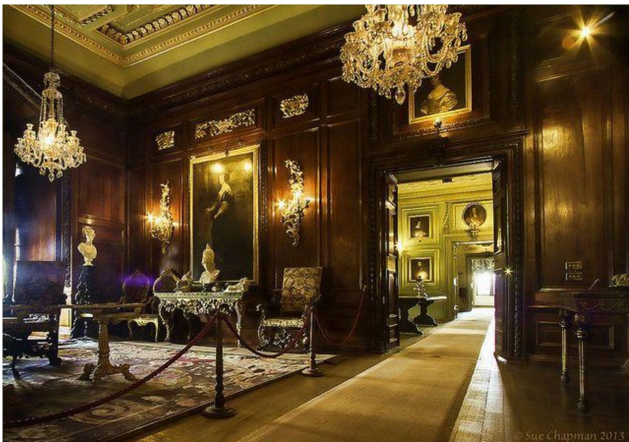
Castelos Medievais: Castelo de Warwick (interior)