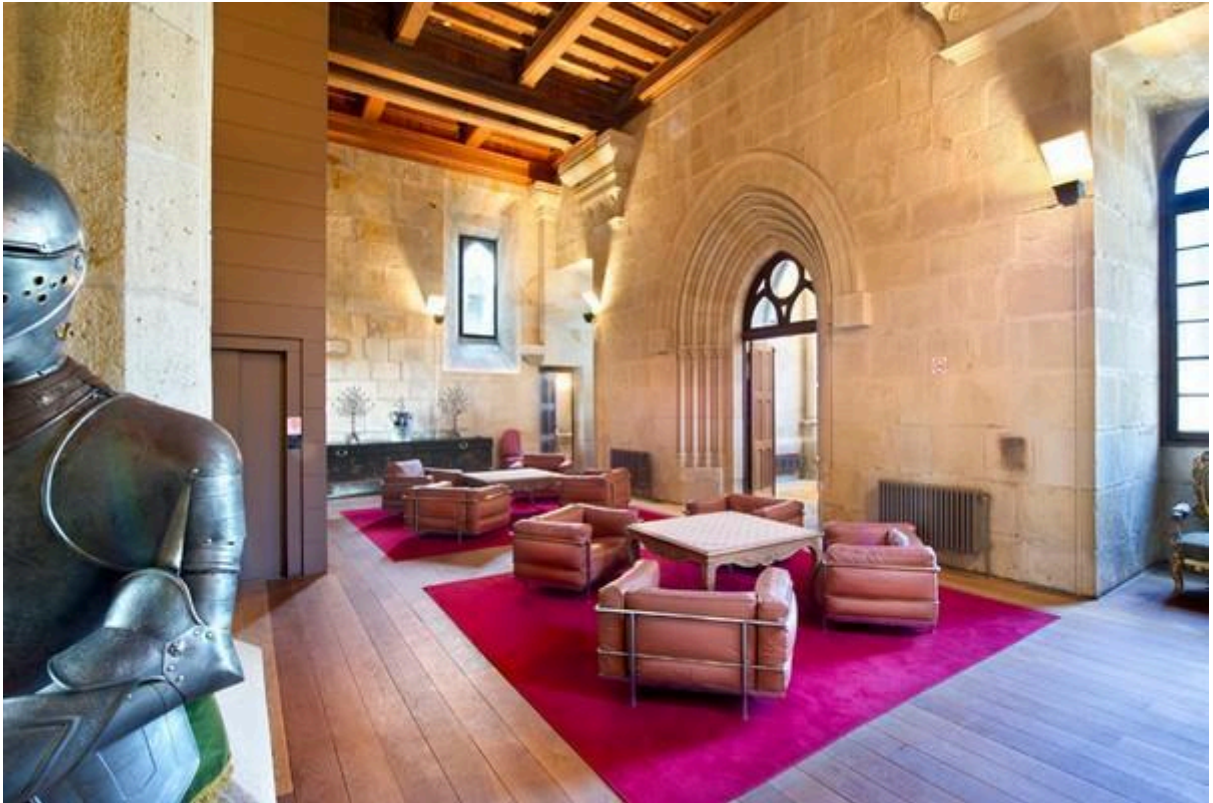
Castelos Medievais: Castelo de Butrón (interior)