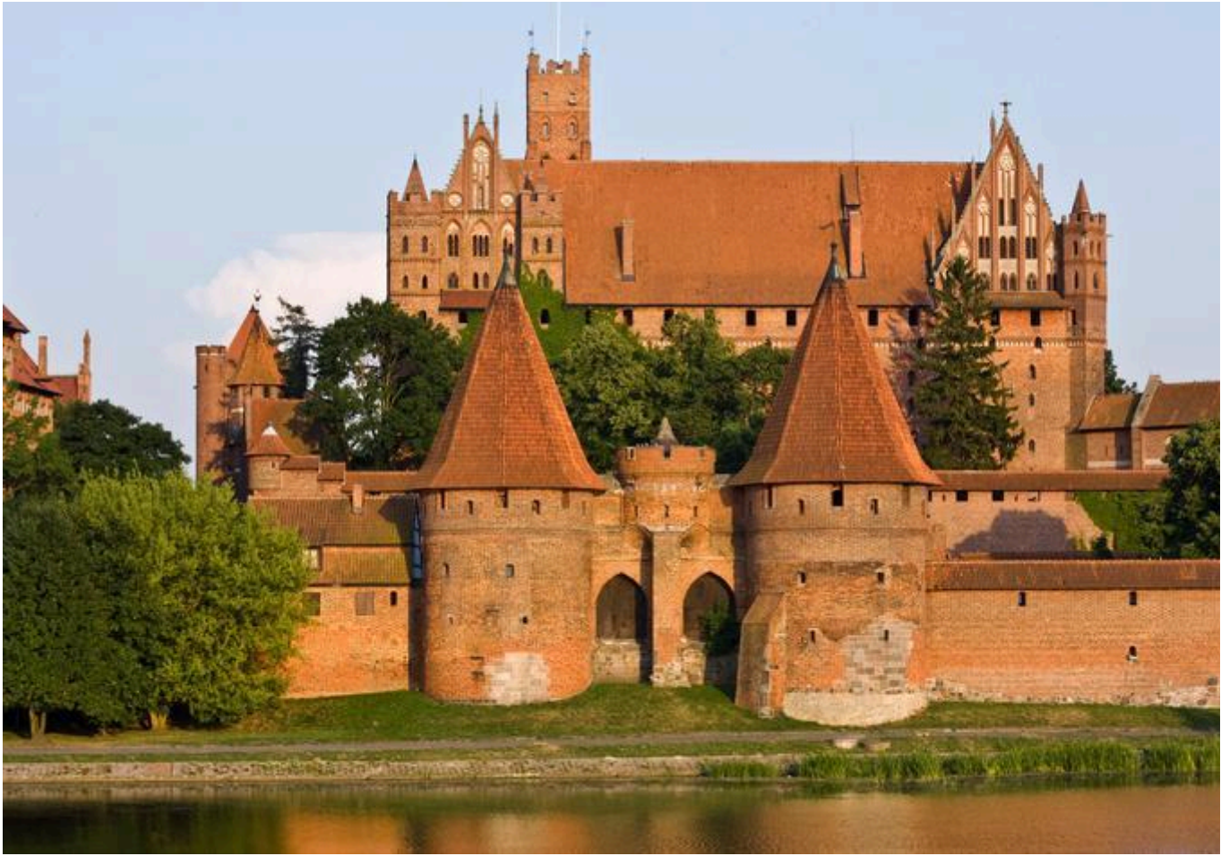
Castelos Medievais: Castelo de Malbork