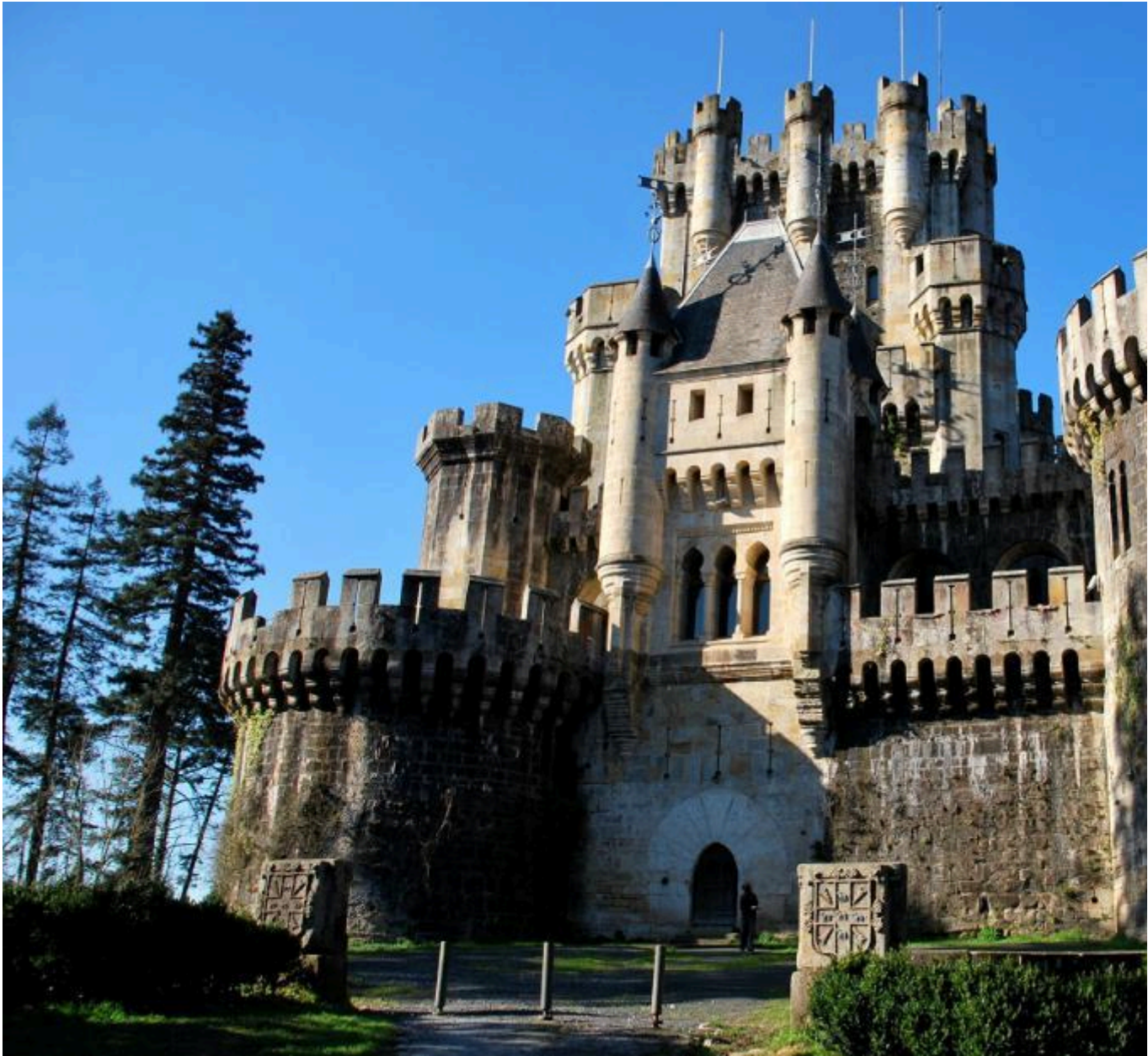
Castelos Medievais: Castelo de Butrón