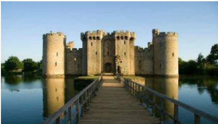
Castelo de Bodiam, na Inglaterra.

Os castelos começaram a ser construídos por volta do ano de 800 sobre ruínas de construções e fortificações romanas. Esses primeiros castelos eram estruturas de madeira protegidas por paliçadas e mais tarde, muros de pedras e rochas.