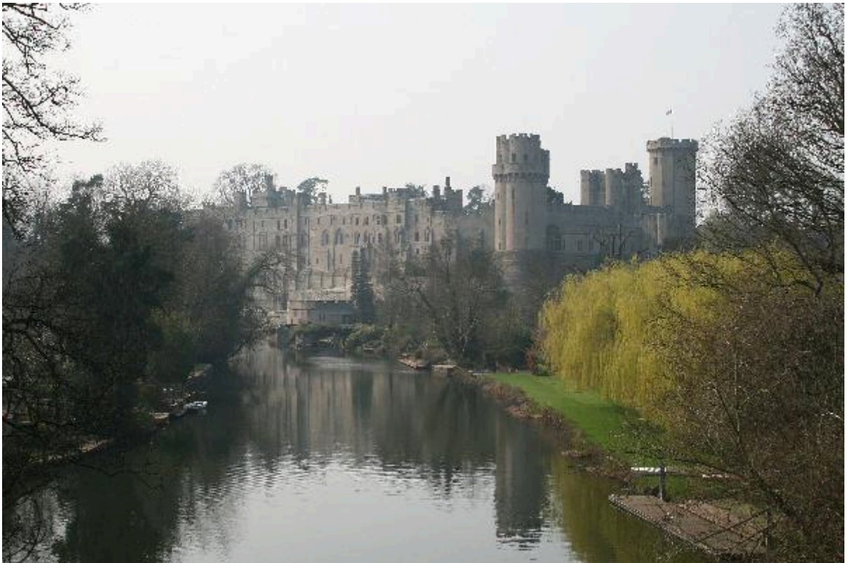
Castelos Medievais: Castelo de Warwick