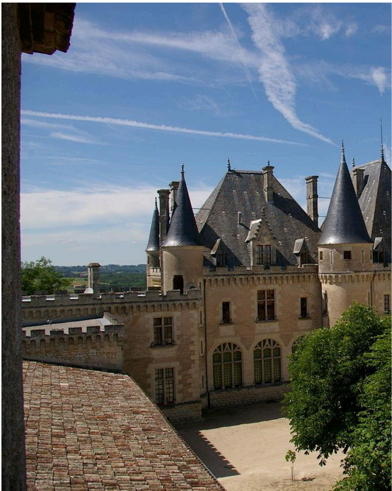
Castelos Medievais: Castelo de Montaigne