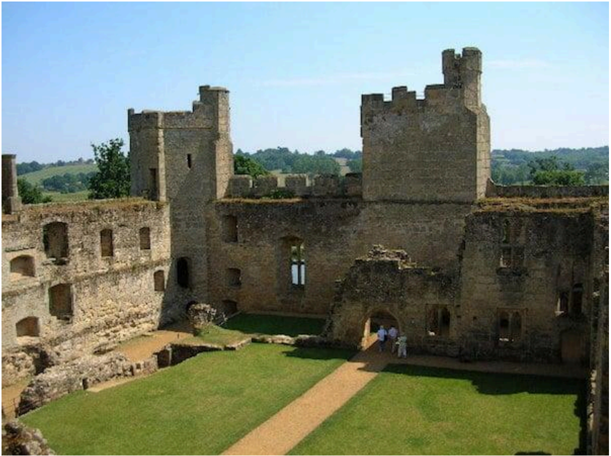
Castelos Medievais: Castelo de Bodiam (interior)

Veja também: As 7 Maravilhas do Mundo – Descubra os Fatos Mais Curiosos Sobre Elas