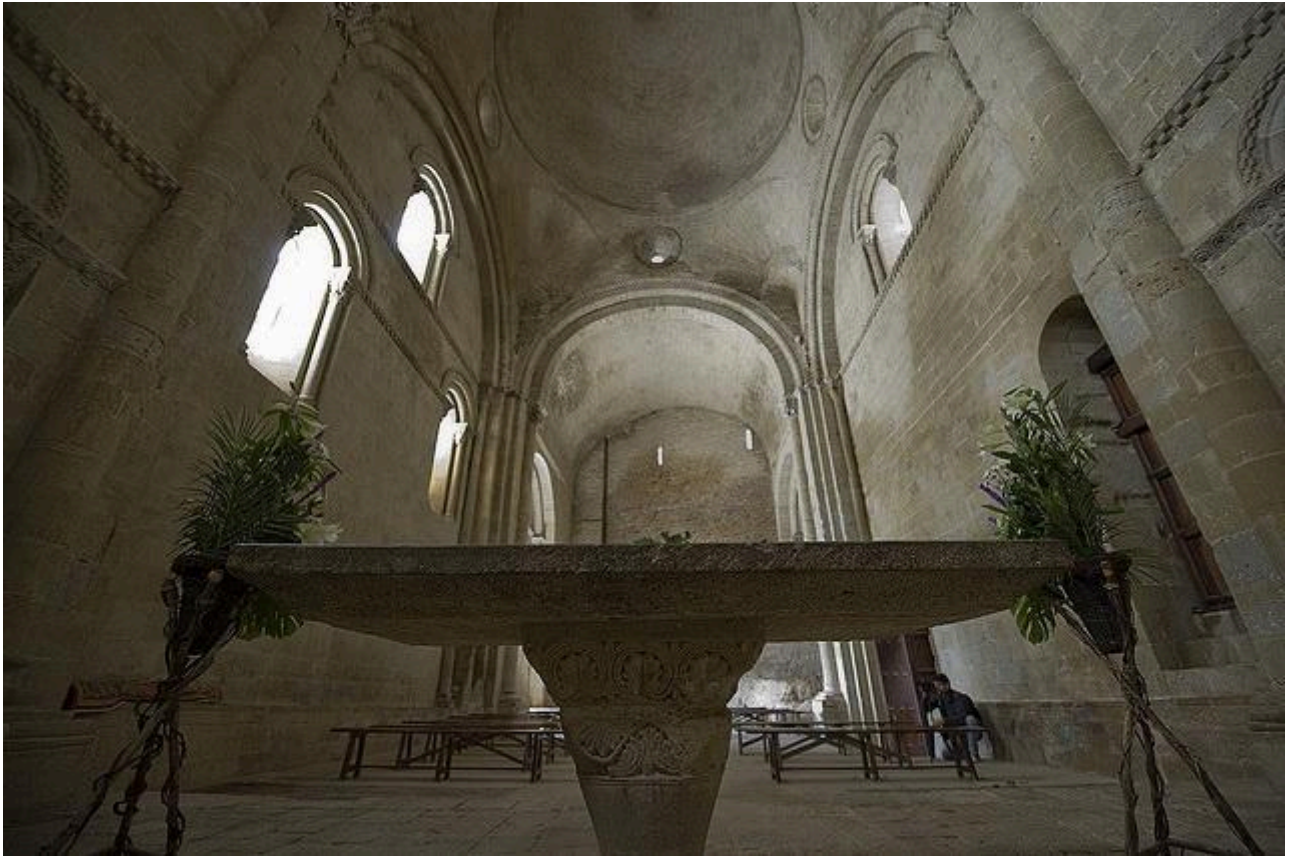
Castelos Medievais: Castelo de Loarre (interior)