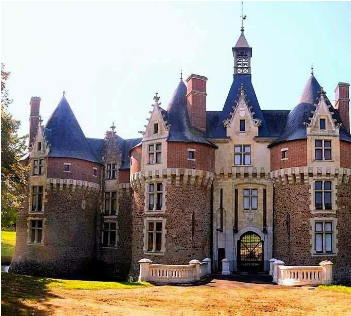
Castelos Medievais: Castelo de Bonnétable