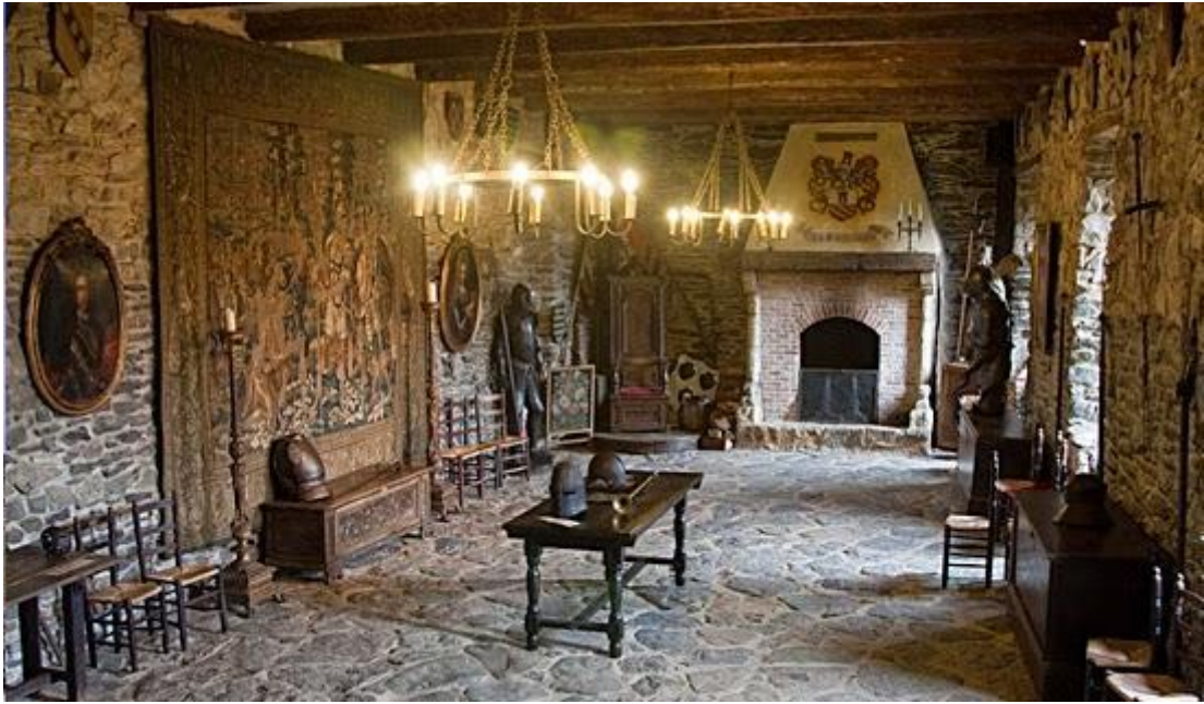
Castelos medievais: cômodo com tapeçaria, móveis de madeira, lareira e armadura de soldados