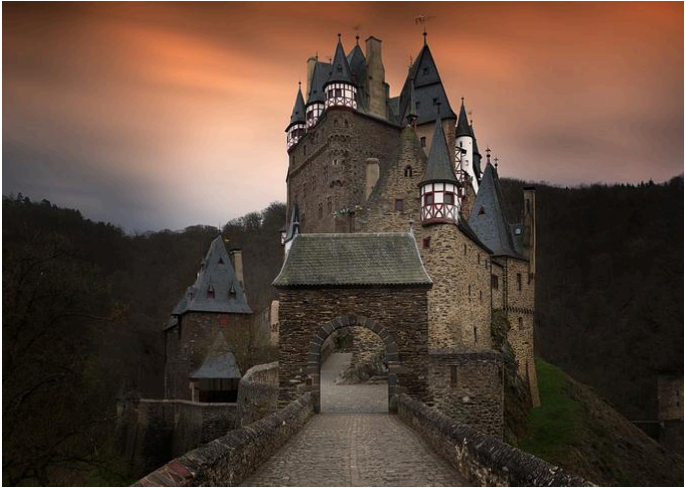
Castelos Medievais: Castelo de Eltz