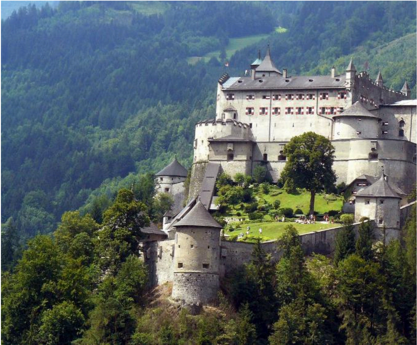
Castelos Medievais: Castelo de Hohenwerfen