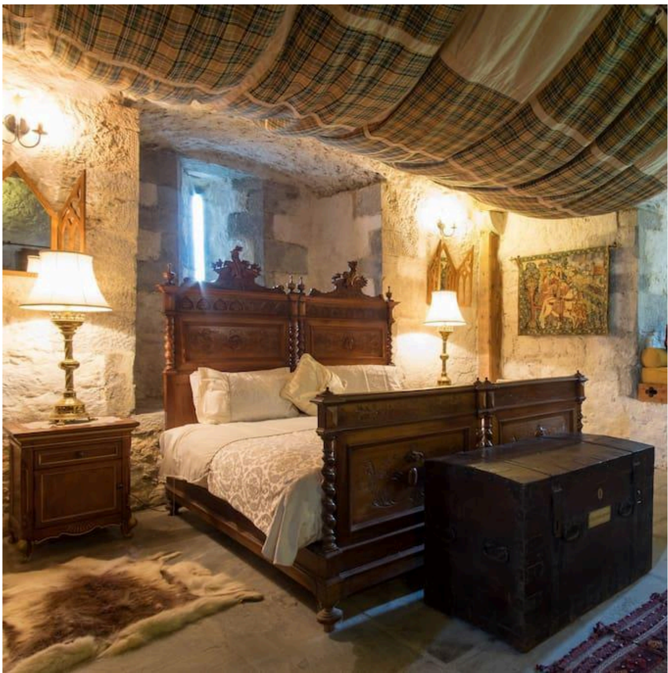
Castelos Medievais: quarto de castelo com decoração medieval