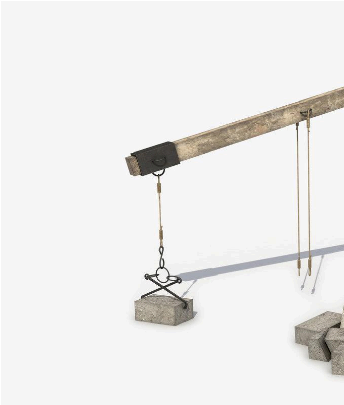
Castelos Medievais: Ilustração de polia

Os muros grossos não eram a única estratégia adotada para a segurança dos castelos. Alguns tinham fossos em sua volta, para dificultar ainda mais a entrada dos inimigos.