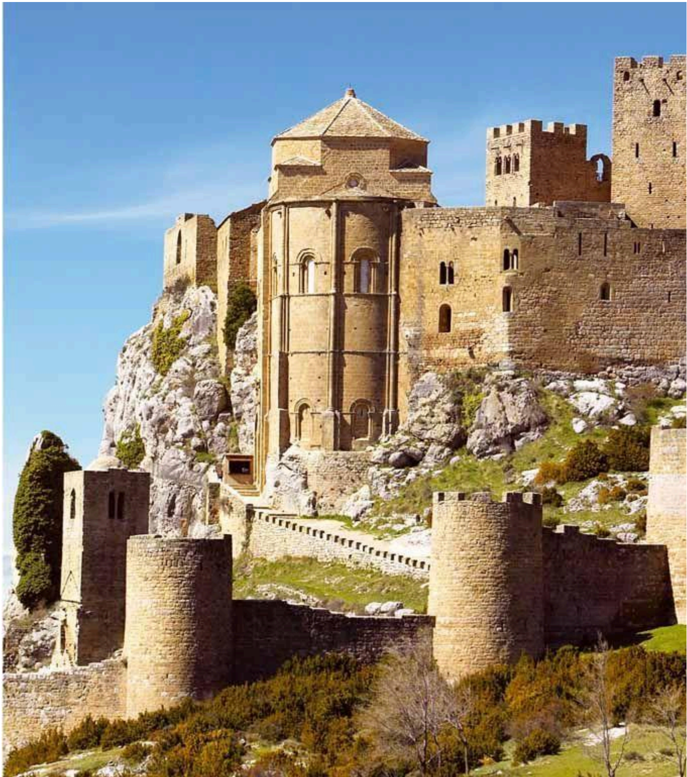
Castelos Medievais: Castelo de Loarre