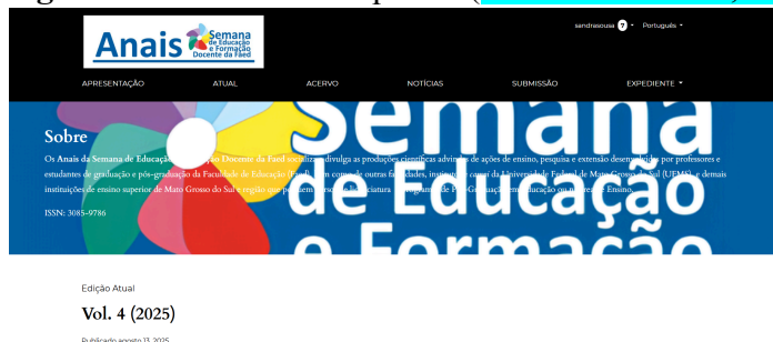
Figura 1 – Alinhada à esquerda (fonte tamanho 12; espaço simples)

Fonte: Autoria própria ou indicação da referência (fonte tamanho 10; espaço simples; 18 pts depois).