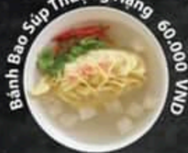
Bánh Bao Súp Thượng Hạng 60.000 VND