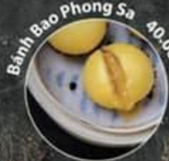
Bánh Bao Phong Sa 40.000 VND