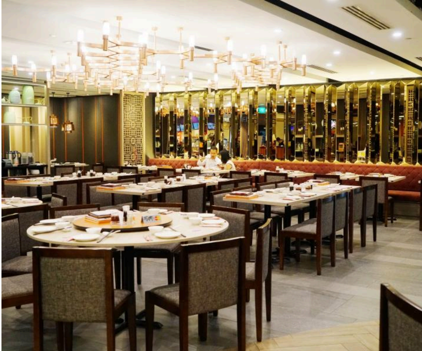
Crystal Jade Kitchen