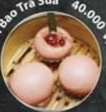
Bánh Bao Trà Sữa 40.000 VND