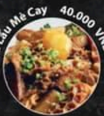
Phở Lẩu Mê Cay 40.000 VND