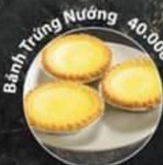
Bánh Trứng Nướng 40.000 VND