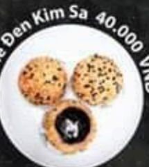
Mê Đen Kim Sa 40.000 VND