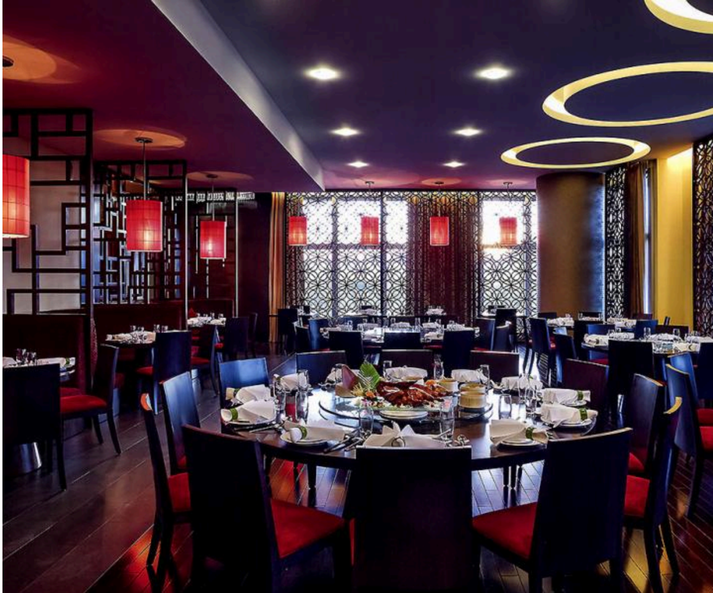
The Golden Dragon Restaurant