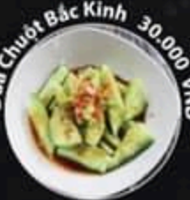
Dưa Chượt Bắc Kinh 30.000 VND