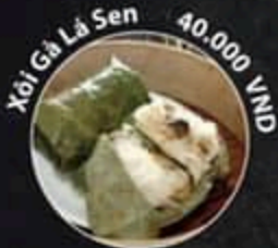
Xôi Gà Lá Sen 40.000 VND