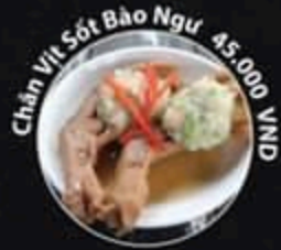
Chân Vịt Sốt Bào Ngư 45.000 VND