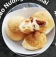
Bánh Bao Nướng Pho Mai 45.000 VND