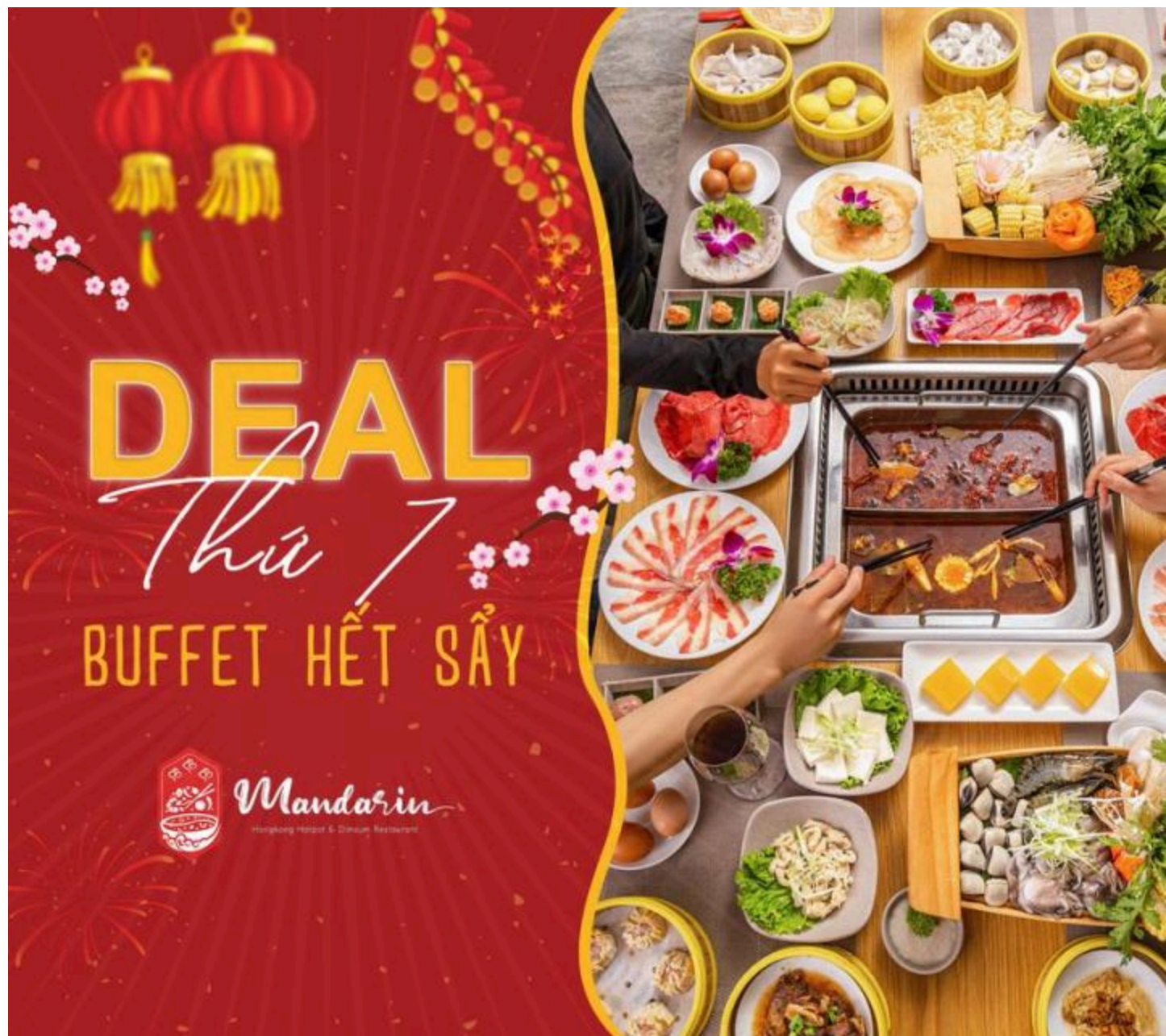
Mandarin HongKong Hotpot & Dimsum Restaurant

Fanpage: www.facebook.com/Mandarin.HaianRiverfront/ Giờ mở cửa: 10:30 – 22:00