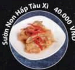
Sườn Non Hấp Tàu Xì 40.000 VND