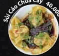
Sủi Cáo Chua Cay 40.000 VND