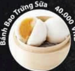
Bánh Bao Trứng Sữa 40.000 VND