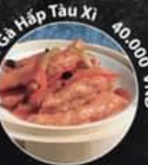
Chân Gà Hấp Tàu Xì 40.000 VND