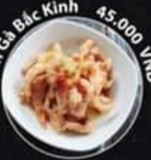
Chân Gà Bắc Kinh 45.000 VND