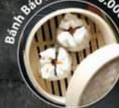
Bánh Bao Xả Xiu 40.000 VND