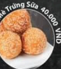
Bánh Mê Trứng Sữa 40.000 VND