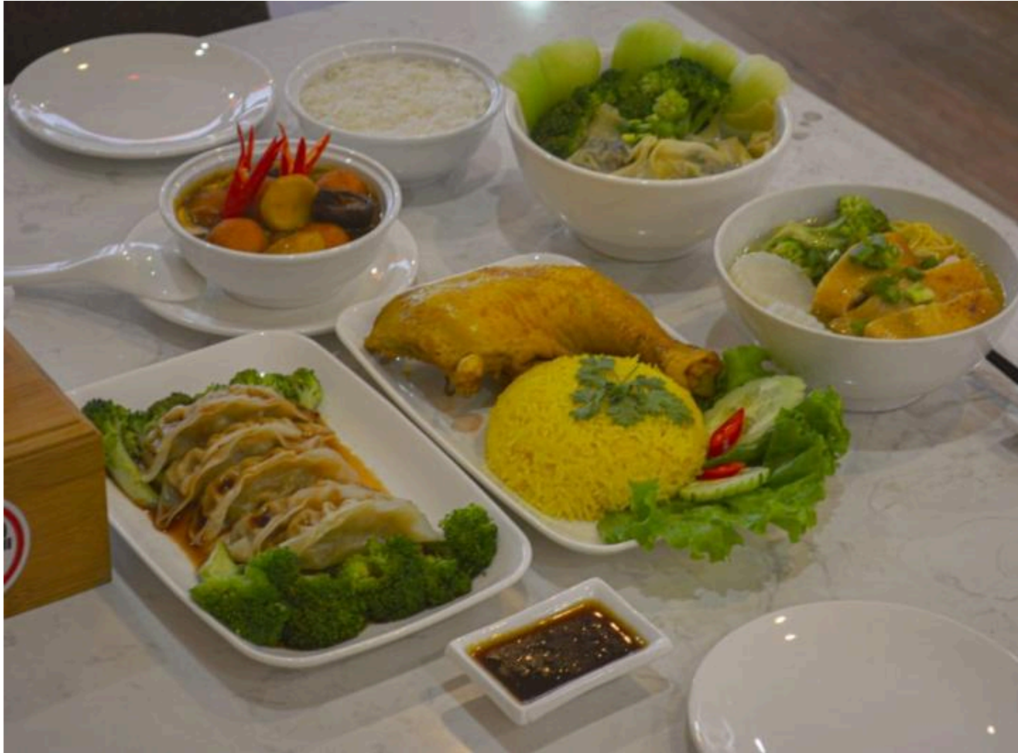
Hong Kong Dim Sum King Danang

Điện thoại: 023 6391 2888 Email: enquiry@hkdimsumking.com Website: http://hkdimsumking.com/ Fanpage: www.facebook.com/hkdimsumking Giờ mở cửa: 11:00 – 22:00