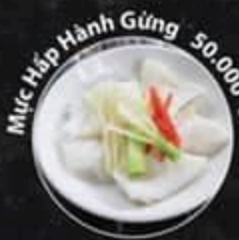
Mực Hấp Hành Gừng 50.000 VND