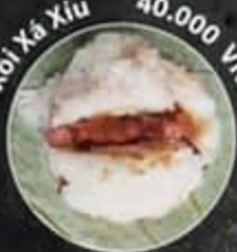
Xôi Xả Xiu 40.000 VND