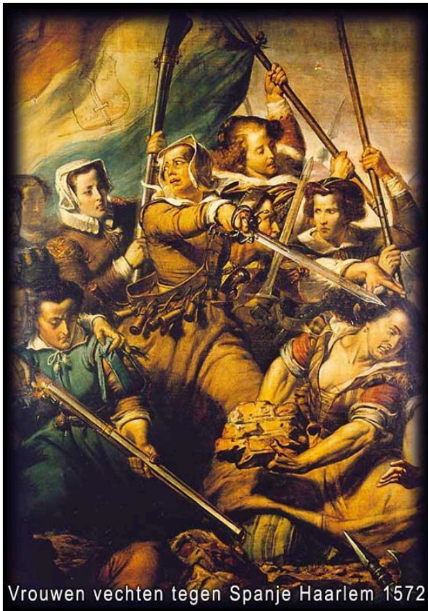
Vrouwen vechten tegen Spanje Haarlem 1572

Willem van Oranje liet het er niet bij zitten. Hij wilde zijn bezittingen terug en hij steunde de protestanten .