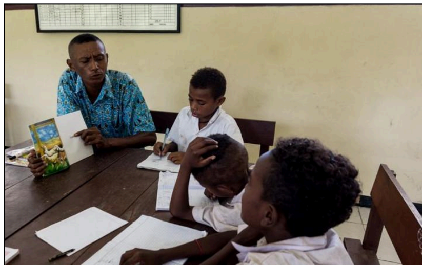
Gambar 3. Contoh Gambar dengan Resolusi Cukup

Bagian pembahasan penelitian berisi diskusi hasil penelitian dan perbandingan dengan teori dan atau penelitian sejenis.