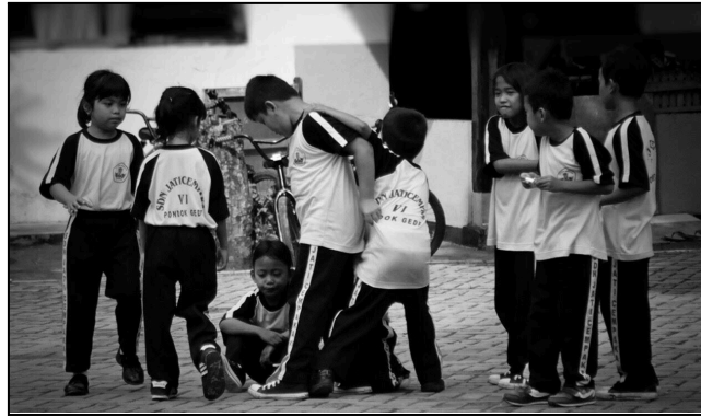
Gambar 2. Contoh Gambar dengan Resolusi Kurang