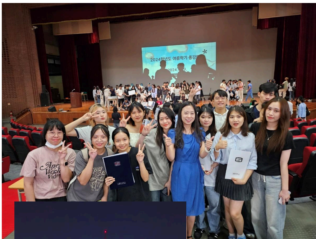
(語學院三級班結業式)