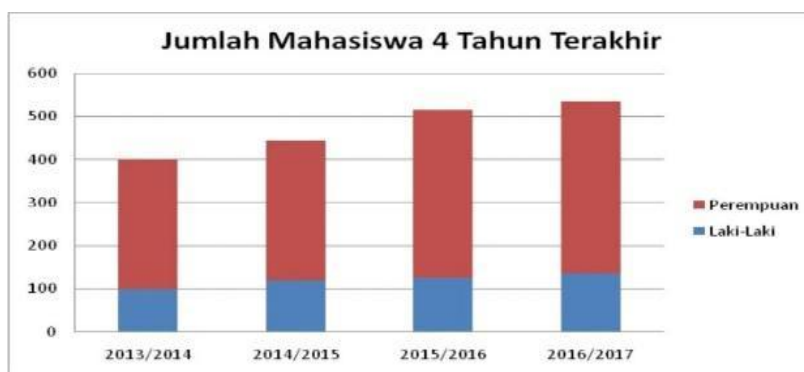
Grafik 1. Contoh Grafik

Penulisan rujukan atau pengutipan menggunakan aplikasi Mendeley dengan style Turabian 8 th edition (full note) .