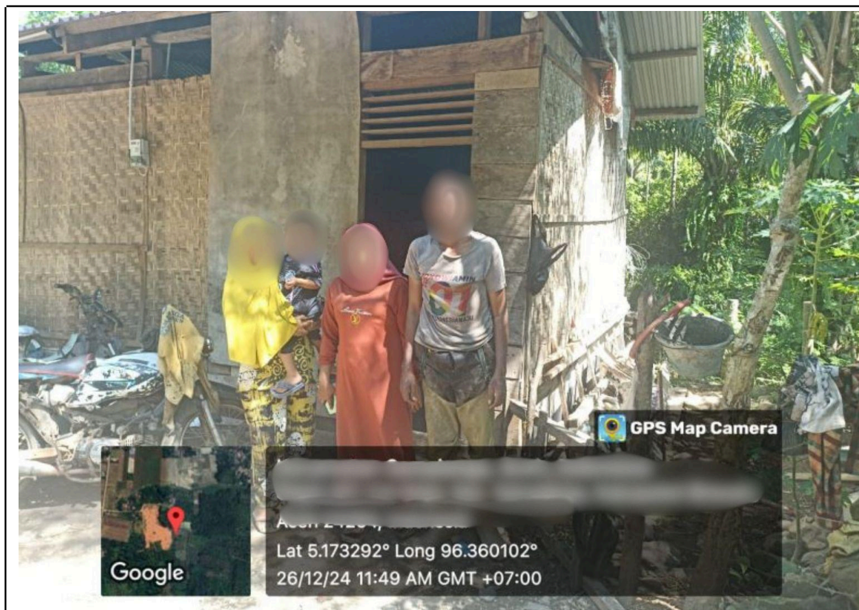
FOTO RUMAH TEMPAT TINGGAL SESUAI ALAMAT DOMISILI

(baik yang tinggal dengan orang tua, tidak tinggal dengan keluarga inti, Anak Panti, maupun yang karena perpindahan tugas orang tua/wali)