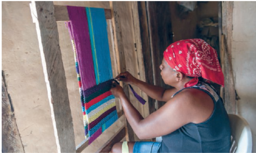
André Dib/Pulsar Imagens Figura 12. Quilombola produzindo tapete em tear artesanal, em Cavalcante (GO), 2017.

extrativismo, a produção de artesanato (figura 12), a recepção de turistas que querem conhecer a vida em um quilombo e a produção cultural, expressa por meio de festividades, danças e músicas.