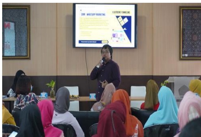
Gambar 1. Pelaksanaan Penelitian

(Isi Tabel : Cambria 9 pt, spasi tunggal, gunakan hanya garis horizontal untuk batas)