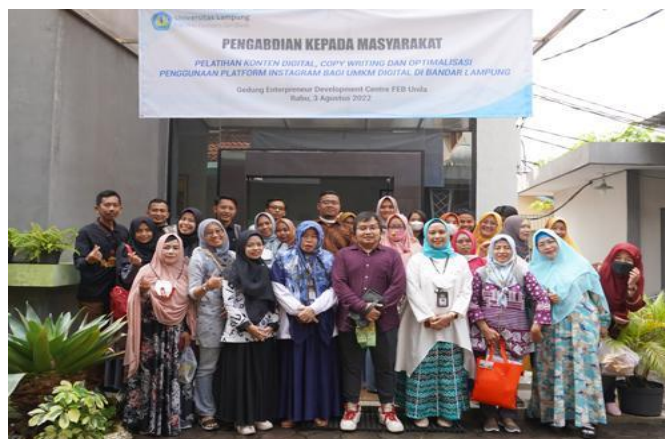
Gambar 2. Photo Bersama

(Juduk Gambar : Cambria, 10 pt, Spasi before dan after 0 pt dan line spasi Tunggal, Align Center, Bold (Tulisan Gambar 1 dst..))