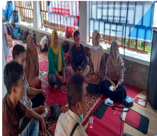
Gambar 1. Pelaksanaan Pengabdian