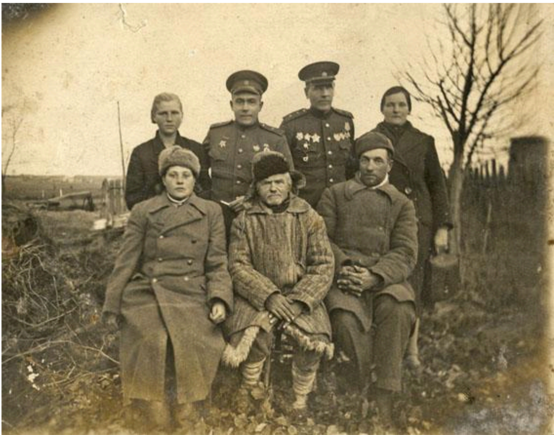
Командующий 3-ей армией А.В. Горбатов среди крестьян Костюковичского района 1943 г.