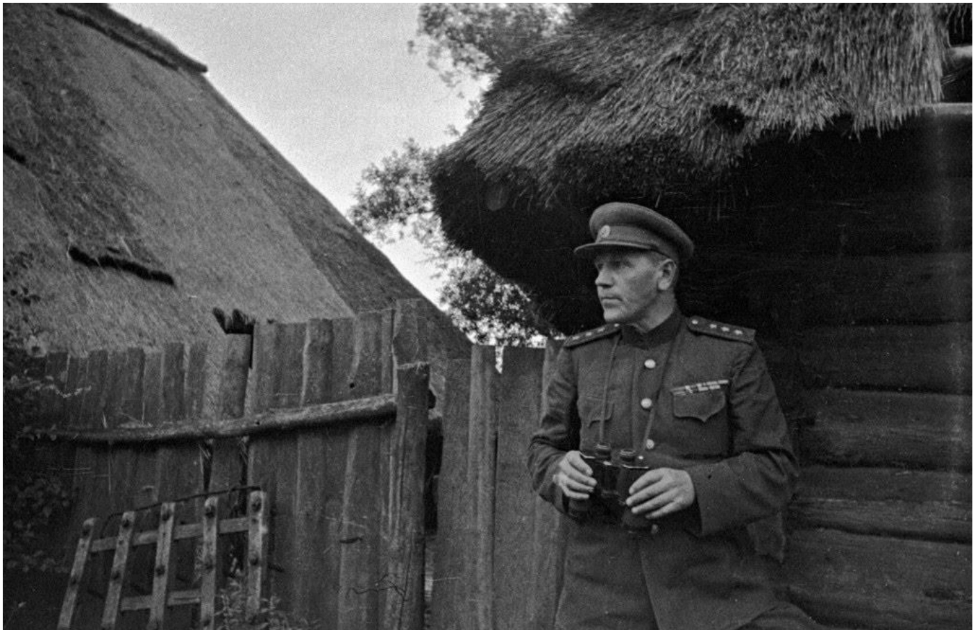
Командующий 3-й армией генерал-полковник Александр Горбатов. 1944 год