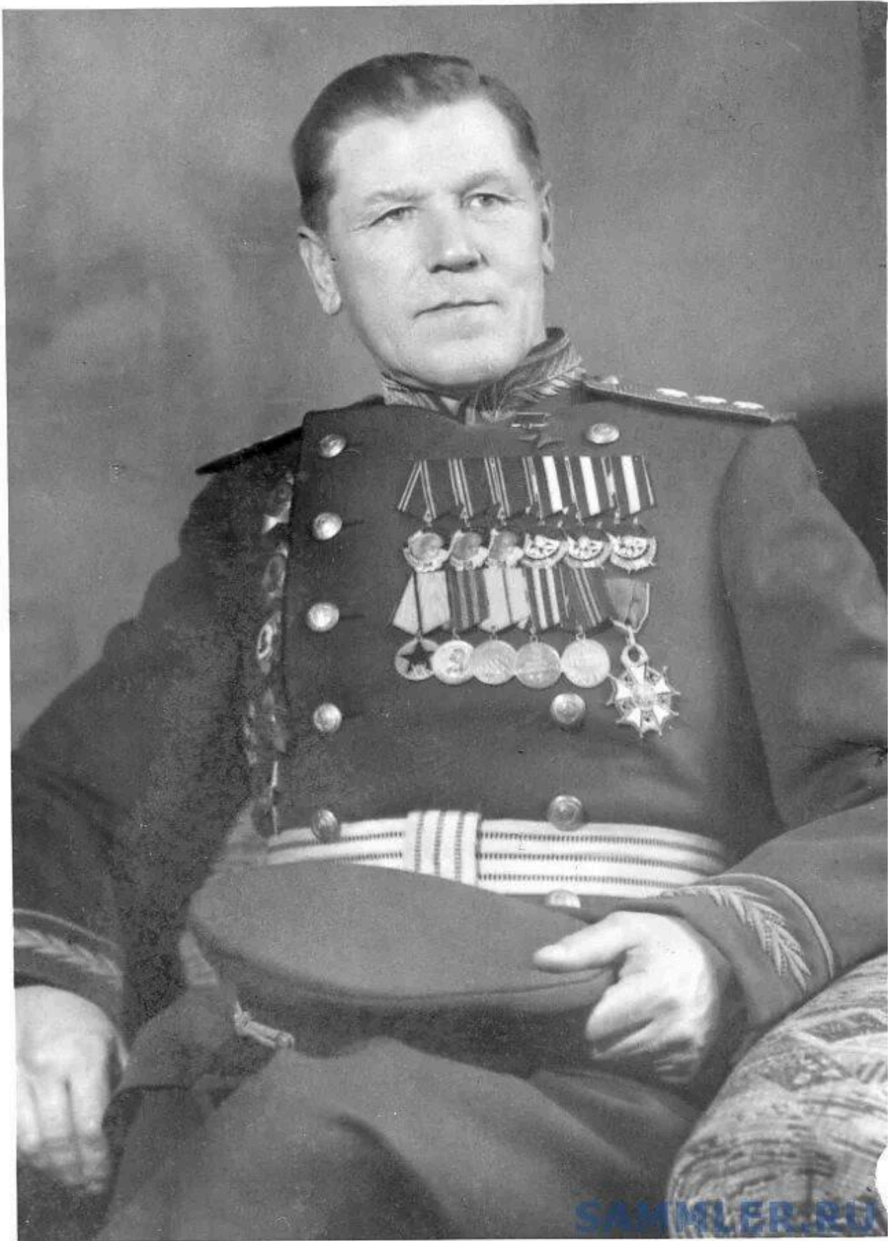
Горбатов Александр Васильевич (1891 – 1973) родился в д. Пахотино, (ныне Палехского района Ивановской области) в семье крестьянина. На военной службе с 1912 г., в Красной Армии с 1918 г. Во время Гражданской войны активно участвовал в