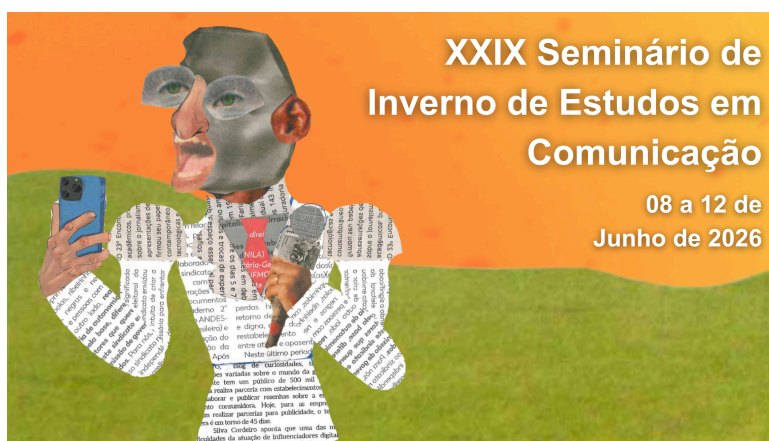
Figura 1 – Título da figura 1