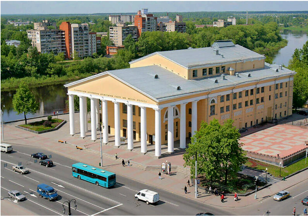
3.Третья страничка «Мир без музыки, что птица без крыльев» Городская ратуша