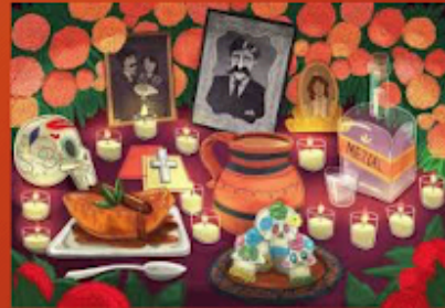
Celebración del día de los muertos.

Sin embargo, también viví (I lived) durante muchos años en la ciudad de Nueva York. La cultura de esa ciudad se ha convertido en (has become) una parte de mí.