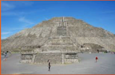
La pirámide del sol, Teotihuacán, México.

He pasado (I have spent) mucho tiempo en México. Estoy muy conectada con el país (the country), la gente, y las tradiciones. Entonces, siento que la cultura mexicana ha contribuido a (has contributed to) mi propio sentido de cultura.