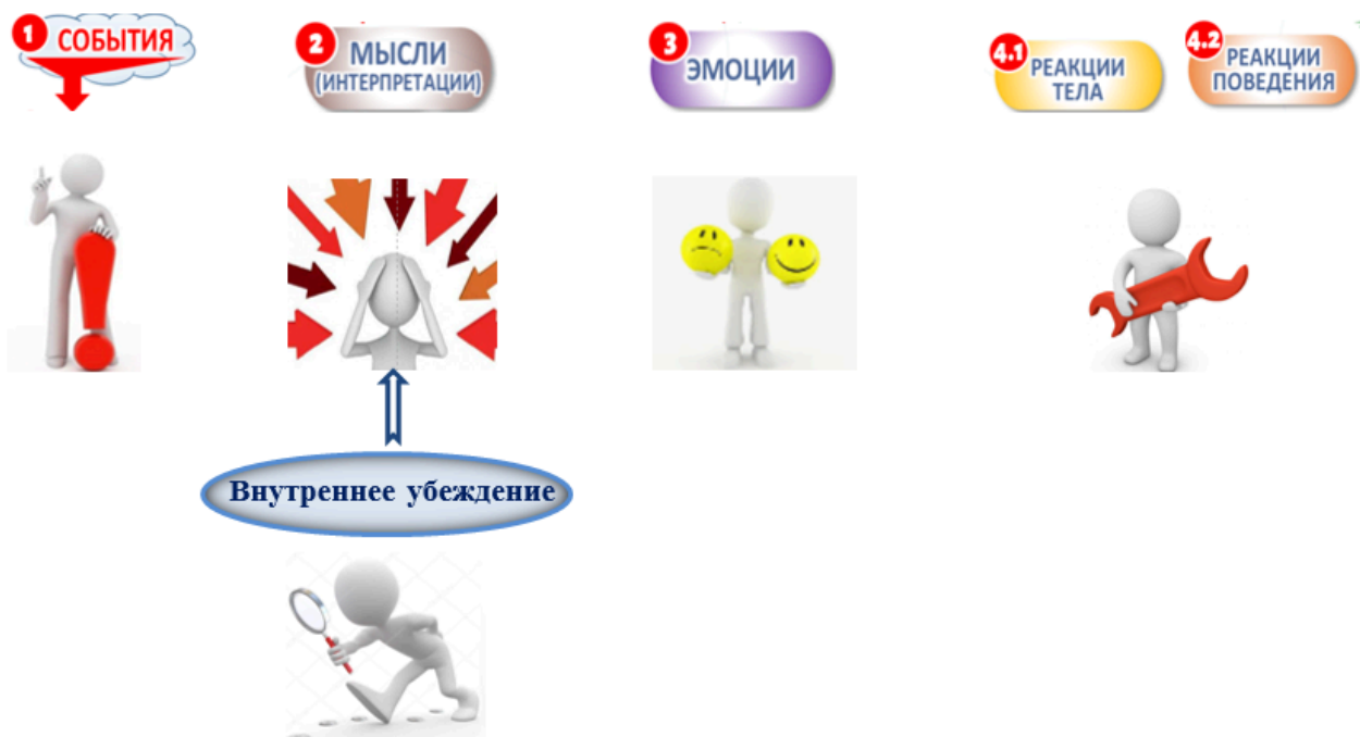
Рисунок 2 – Механизм эмоционального реагирования

Искажение мышления – представление прямой зависимости событие – последствие – позволяет снять с себя ответственность за собственные эмоции, чувства и поведение и лишить себя возможности конструктивно влиять на ход событий и свое эмоциональное состояние.