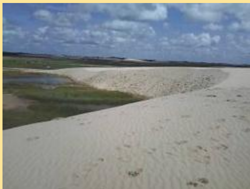
Médanos de Apure.