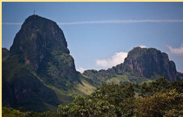
Monumento Natural Arístides Rojas.

El Monumento Natural Arístides Rojas: Mejor conocido como los Morros de San Juan, se encuentra en los llanos centrales de Venezuela. Es un sistema de rocas caliza formado por la deposición de sedimentos marinos.