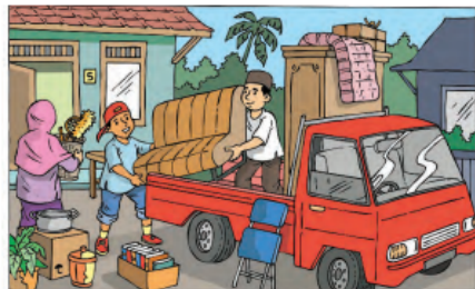
Gambar 10.4 Pindah rumah