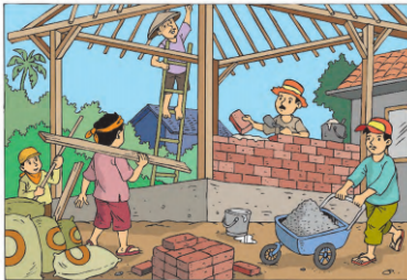
Gambar 10.2 Membangun rumah