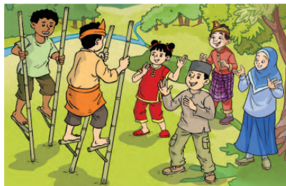
Gambar 10.5 Anak-anak beragam suku dan agama sedang bermain

Ceritakan pengalaman kalian melakukan kegiatan bersama sahabat yang berbeda suku dan agama!