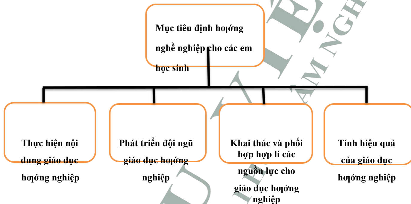
Hình 2.1. Sơ đồ công tác giáo dục hướng nghiệp

Trường THPT Xuân Mai thực hiện công tác giáo dục hướng nghiệp có các mục tiêu cụ thể được mô tả như sau: