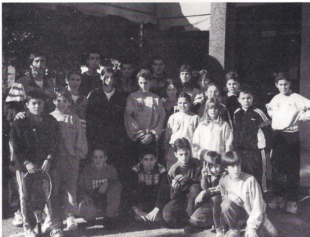
Equipo Infantil de la S.D. Hípica que se desplazó al Club Tenis Bamio, en Orense, para participar en el 7º Triathlon Infantil Masculino y Femenino

Los días 21 y 22 de Junio celebramos el citado II TRIATHLON ESCUELA DE TENIS, participando todos los alumnos en las pruebas de Atletismo, Fútbol y Tenis. El día 22, coincidiendo con la FIESTA FIN DE ESCUELA, se instaló una Tómbola con material deportivo distribuido a lo largo de la pista de tenis, demostrando todos los participantes sus habilidades a la hora de acertar en los premios. A continuación, se les invitó a una comida en el Salón Comedor de la