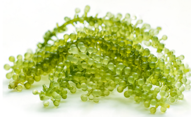
Gambar 2. Anggur Laut ( Caulerpa lentilifera )

Grafik hasil merupakan bagian dari gambar sehingga, dituliskan keterangan gambar dengan peletakan dibawah gambar dan posisi ditengah. Grafik yang dibuat harus sederhana, informastif dan mudah dipahami.