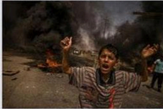
Kirkuk, 2010 A few girls, looking from a wall of plaster and fire during a protest, 20 miles north of Kirkuk in Iraq's Sunni-rich region on Friday, August 13, 2010. Some protesters are holding the flag of the Islamic Party, which burned down in the Iraqi capital, Baghdad, in 2003. The new government's failure to provide basic services such as clean water, electricity and fuel, government forces' withdrawal from the north, the Iraq stock exchange's closing and the Iraqi government's withdrawal from the coalition, combined with the breakdown of oil flow from the north, led to the Sunni insurgency in the region.