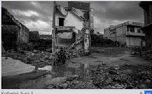
Kraferbel, Syria 3 A boy, seen in a building, looks out from an old street in the village of Kraferbel, Syria on Friday, October 10, 2011, as the war approaches the third year. Syria's conflict is the most deadly in the world, with more than 100,000 people killed and millions displaced.