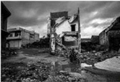
The streets of a city in ruins, Aleppo, Syria.