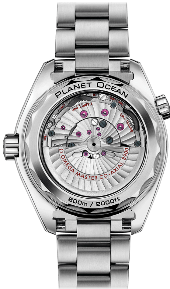
Mặt lưng OMEGA Planet Ocean 600M CO-AXIAL 215.90.44.21.99.001

OMEGA Seamaster Planet Ocean 600M Master Chronometer có khả năng chịu nước đến 600 mét (tương đương 2000 feet hoặc 60 bar) và có van thoát khí Heli. Nó được trang bị bộ máy Calibre 8900 và bạn hoàn toàn có thể chiêm ngưỡng qua mặt lưng trong suốt của đồng hồ. Bên cạnh đó, để đạt được trạng thái tốt nhất cho cái danh Chronometer của mình, nó đã vượt qua 8 bài kiểm tra nghiêm ngặt do METAS (Viện đo lường Liên bang Thụy Sĩ) đặt ra.