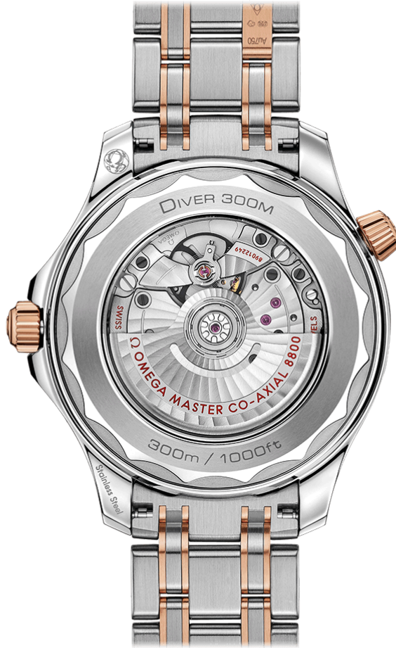
Mặt lưng OMEGA Seamaster Diver 300m 210.20.42.20.03.002

Super-LumiNova trắng với viền rose-gold nổi bật, đảm bảo tính dễ đọc cho người đeo. Lịch ngày thu mình trong một ô cửa chữ nhật tại vị trí 6 giờ.