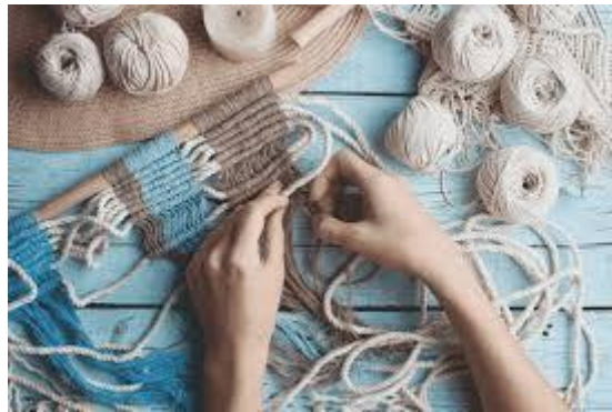
Gambar 1. Ecovitraps dalam rumah